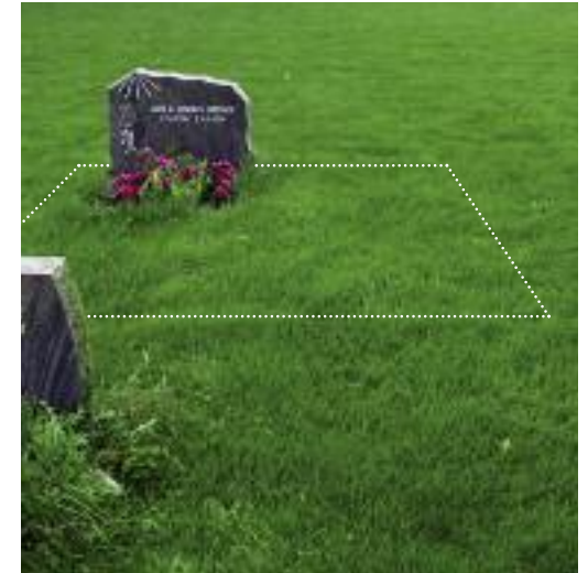
DOBBELTGRAV Gravminnet plasseres over den graven som først blir tatt i bruk.

En avdød, som er bosatt i Grimstad, eller med tilhørighet til Grimstad, kan fritt bli gravlagt på hvilken som helst av kirkegårdene i kommunen, men fortrinsvis på den kirkegården vedkommende sokner til. Med tilhørighet menes at avdøde eller foreldrene