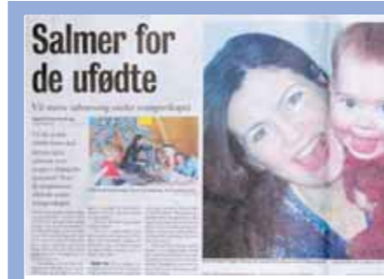
Faksimile Vårt Land 1. februar

SALMER VED REISENS BEGYNNELSE I en artikkel i Vårt Land 1. februar, refereres det til et prosjekter i den danske folkekirken, der de har satt igang salmesanggrupper for de ufødte, dvs. for mødre med barn i magen.