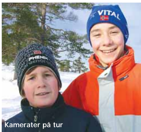
Kamerater på tur