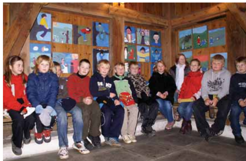
Elever fra 5. klasse ved Fjære skole var i Fjære kirke og så sine egne bilder som var utstilt i våpenhuset. Her har en liten gjeng benket seg foran bildene.