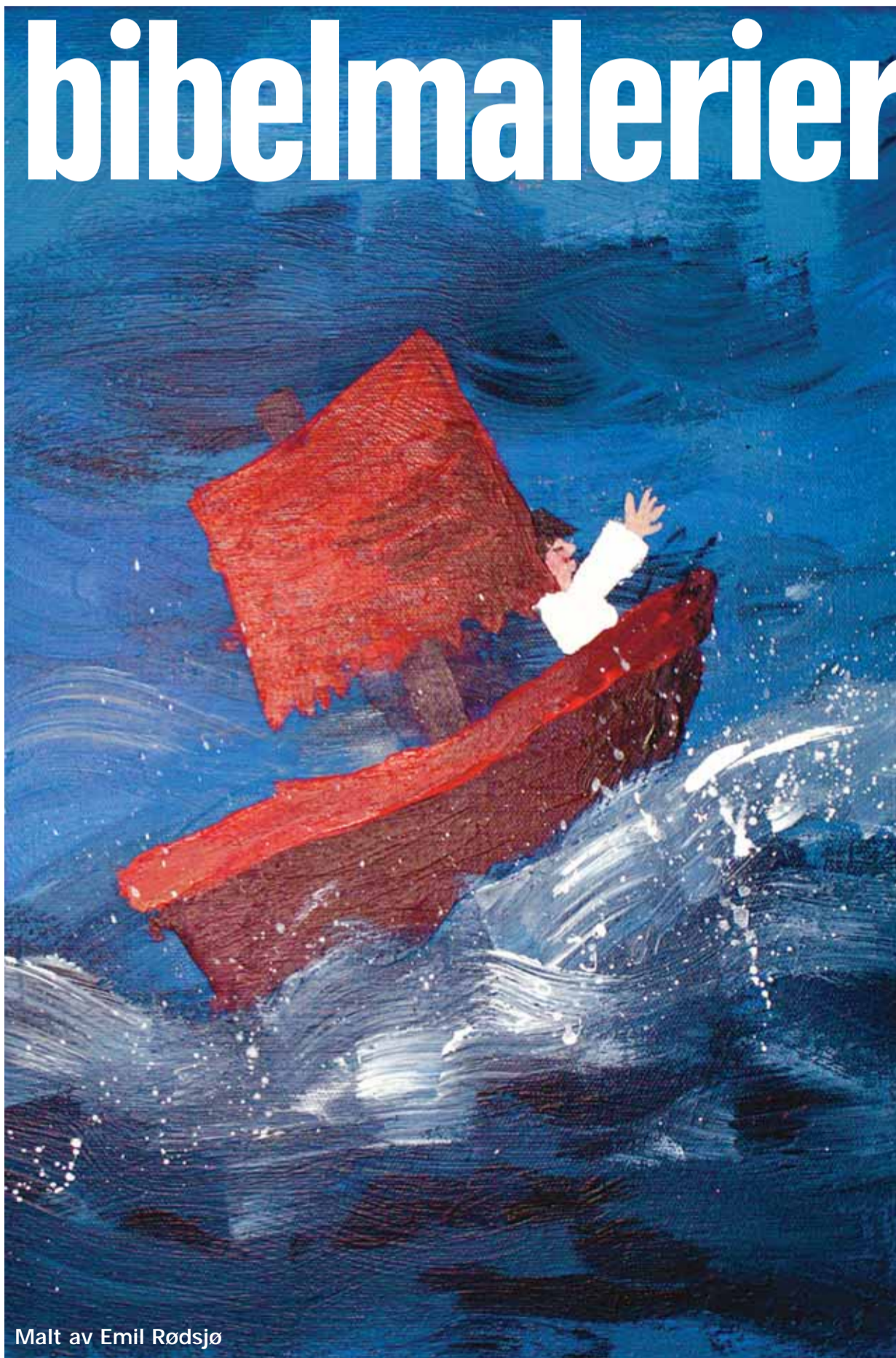
Malt av Emil Rødsjø