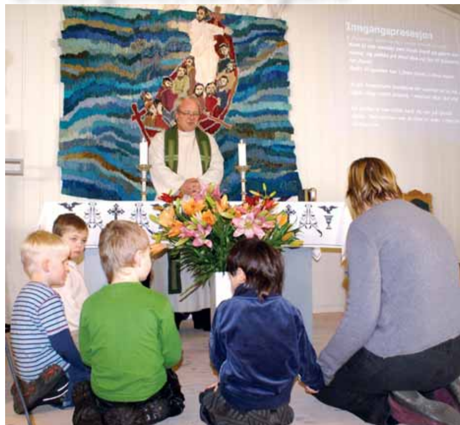
Dåpsskolebarn i Fevik kirke har pyntet alteret med blomster