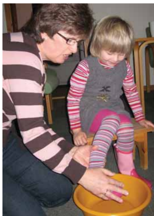
Fortellinger om at Jesus vasket disiplenes føtter, hører også med i påskevandringen

Og om snøen av og til kan dekke over blomstene, så vet vi at når snøen forsvinner så vil det igjen spire og gro!