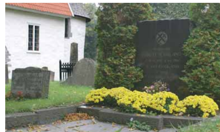
Foreldrenes gravsted på sørsiden av Fjære kirke.

– Jeg får si som min mor ofte sa: Det er mye mellom himmel og jord vi ikke forstår, for eksempel uendeligheten i verdensrommet. Kristendommen er vår kulturarv. Den må vi ta vare på. Tro, håp og kjærlighet, og det største av alt er kjærligheten.