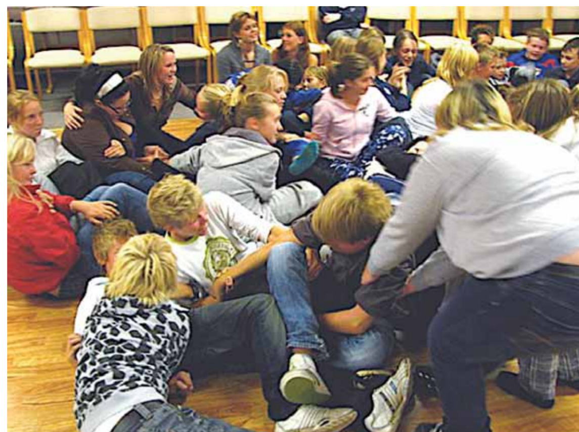
Dette er ikke slagsmål, men mer en type bli-kjent-aktivitet. En bokstavelig måte å komme sammen på.

Det har vært stilt spørsmål ved om det er riktig å reise til Danmark med konfirmantene. Spørsmålet har vært stilt av flere gjennom årene. Og jeg vet ikke svaret på det spørsmålet. Men hvis jeg tenker gjennom alle de turene jeg har fått være med på, så er det ingen ting i veien med Danmark!