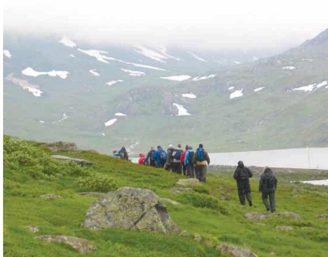
Første etappe gikk oppe i lia langs E139. Været var ufyselig, men alle pilegrimene gjennomførte den ca. 15 km lange økta med stil.

Det var med skrekkblandet fryd 28 ansatte i Grimstad Kirkelige Fellesråd, inkludert staben i Fjære menighet, satte kursen mot Haukeliseter for å gå deler av en pilegrimsvei til Røldal. Målet ble nådd, og slitne pilegrimer kunne bøye kne foran altret og kjenne Guds nærvær i den gamle ærverdige Røldal Stavkirke.