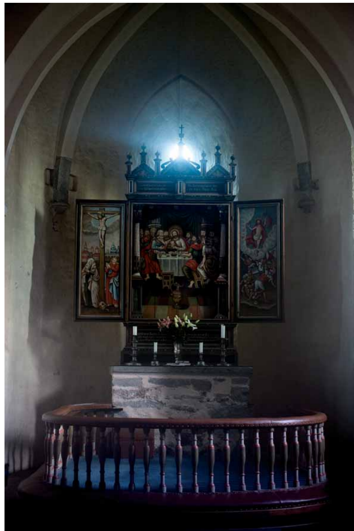
Alteret i Fjære kirke, fotografert av Håkan Berg, som er fotografen bak den kommende praktboken om Fjære middelalderkirke.

priser deg, Far, himmelens og jordens Herre, fordi du har skjult dette for vise og forstandige, men åpenbart det for umyndige små. 26 Ja, Far, for dette var din gode vilje. 27 Alt har min Far overgitt til meg. Ingen kjenner Sønnen, unntatt Far; og ingen kjenner Far, unntatt Sønnen og den som Sønnen vil åpenbare det for. (Matt 11,25-27)