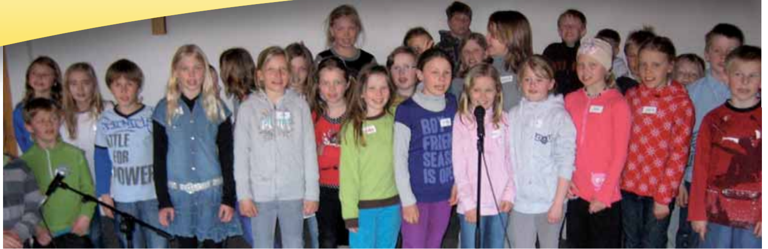
Hele gjengen samlet for å synge for mammaer og pappaer som var møtt fram for å høre på.

Alle som sender inn svar på quizen er med i trekningen av en iPod i desember 2009.