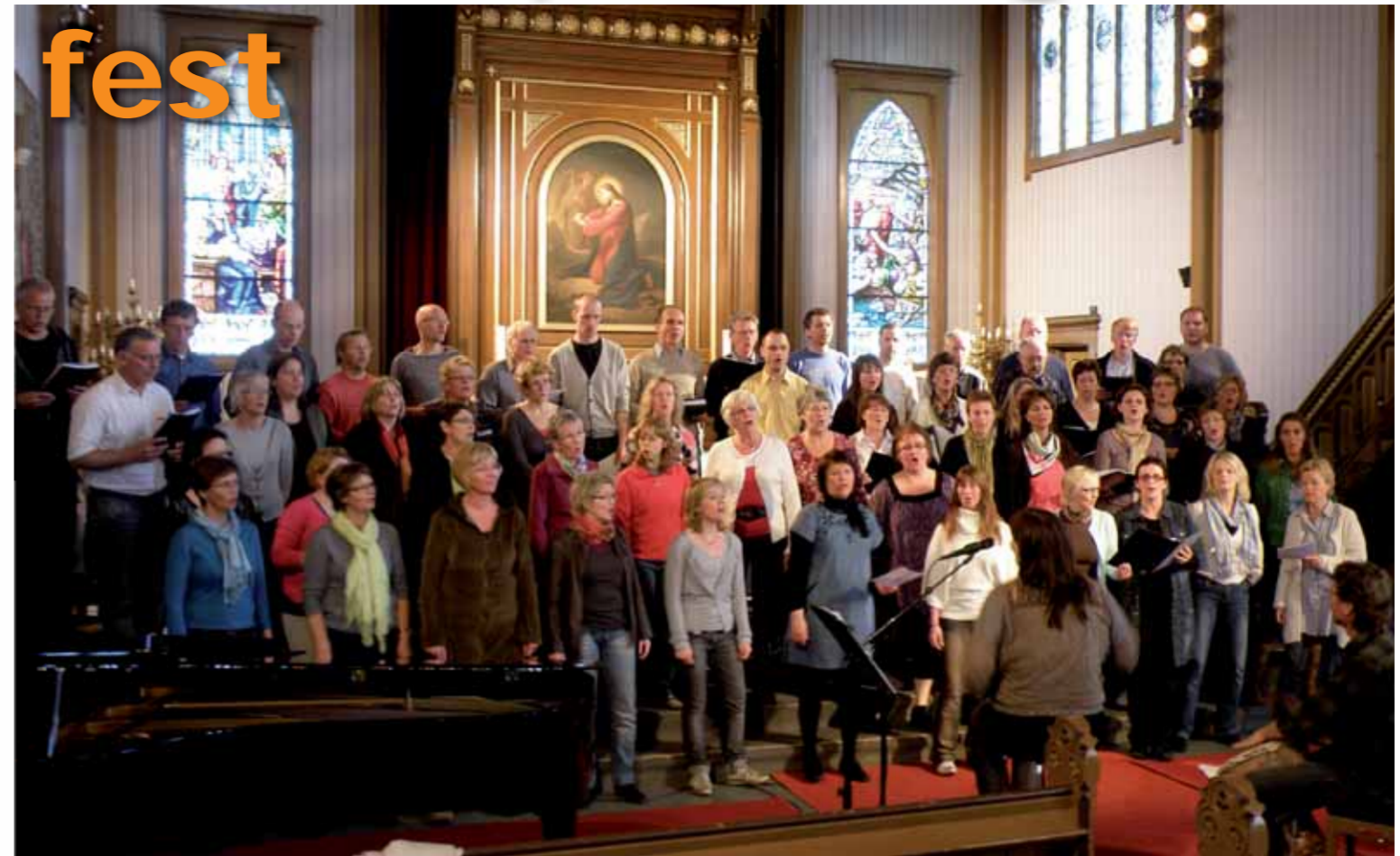
Det store felleskoret av Kor X, Pro Kor og Hesnes Brothers fikk det til å svinge nesten på afrikans vis, men afrikansk nok til å kjenne samhørighet med kontinentet sangene var hentet fra.

Støttekonserten til inntekt for Swazihjelpen ble en formidabel musikkfest. Grunnlaget for den vellykkede konserten til inntekt for Swazihjelpen, var de mange dyktige og musikklade menneskenes frivillige deltagelse på arrangementet i Grimstad kirke søndag 19. april.