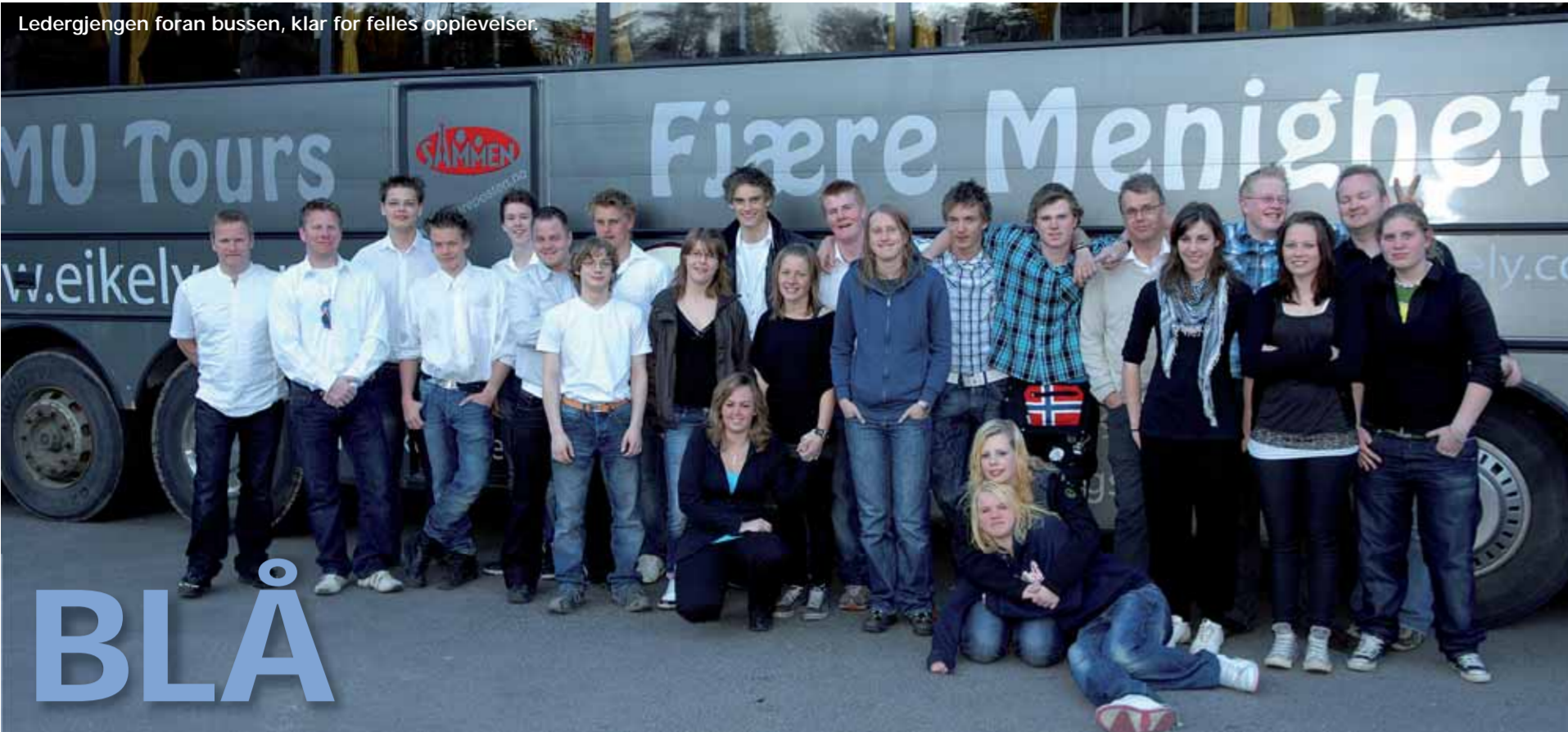
Ledergjengen foran bussen, klar for felles opplevelser.