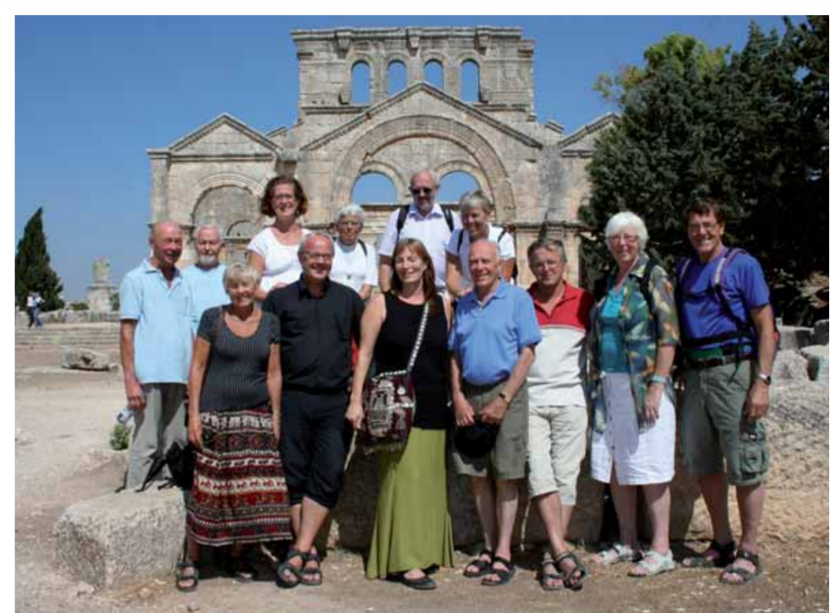
Gjengen fra Grimstad som dektok på Syriaturen

Vi visste at vi skulle overnatte i klosteret, Deir Mar Musa. For å komme dit måtte vi kjøre buss ut i ørkenen og opp i en dal. Da varmen slapp oss av, så vi klosteret ligge høyt oppe i fjellsida. Dit opp slyngte det seg en sti. Vi tok beina fatt i varmen, rundt 25 grader. Med sekk på ryggen og lakenpose og dynetrekk oppi, dro vi oppover, hele reiseselskapet. Vel oppe ble vi tatt godt imot. Fader Paolo leder dette syrisk-katolske klosteret. Syrisk-katolsk betyr at kirken og dermed også klos-