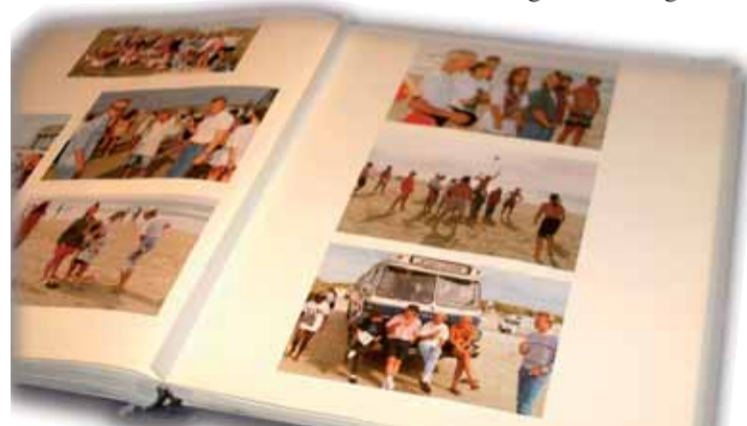
Utklippbøkene er fulle av bilder og utklipp fra turer og hendelser, som representerer individuelle minner og opplevelser for et sted mellom 1000 og 2000 ungdommer, grovt gjettet.

Der kommer vi sammen, ber og lovsynger og deler