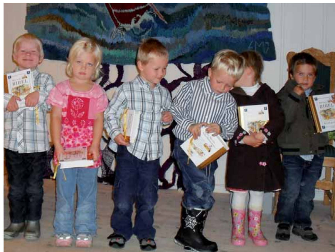
Måtte de bli glad i barnebibelen sin! Fra utdelingen til 4-åringene i Fevik kirke.

På årets høsttakkefest var det mange barn i kirken. For 4-åringene var det en spesiell dag, for de fikk en flott barnebibel med seg hjem. Det er en del av trosopplæringen at det deles ut barnebibler, og vi håper det vil føre til mange