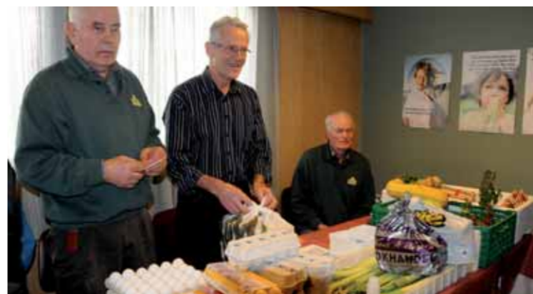
Mannfolk har gjerne andre gaver å bidra med...