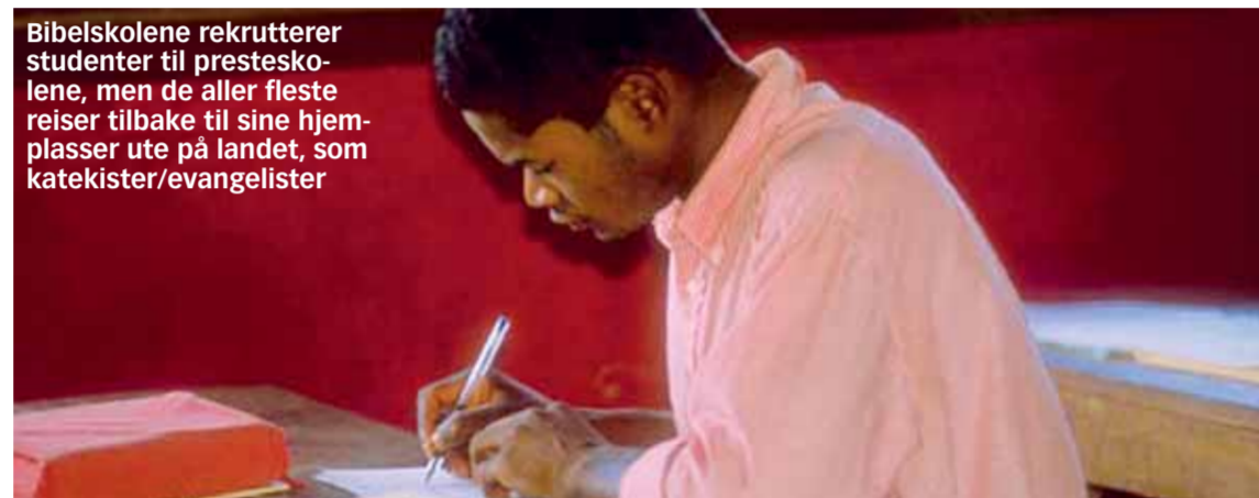
Bibelskolene rekrutterer studenter til presteskolene, men de aller fleste reiser tilbake til sine hjem-plasser ute på landet, som katekister/evangelister

delte meninger i flokken. På den ene side skal en holde seg unna offerskikkene. På den annen side skal en vise solidaritet med de sorgende. Her er kompetansen og kunnskapen om hedenskapet stor. Dette har de vokst opp i og kjenner godt. Folket her er bara. Barastammen står i det store og hele utenfor kirken.