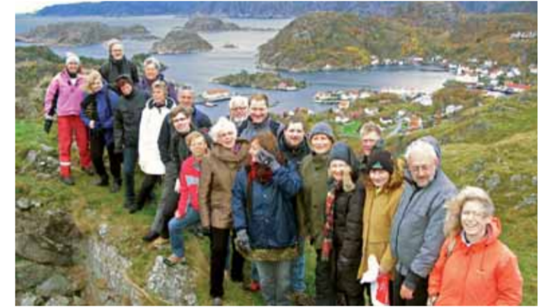
Oppvarmingstur til festningen over Kirkehamn, med flott utsyn over det særegne landskapet.