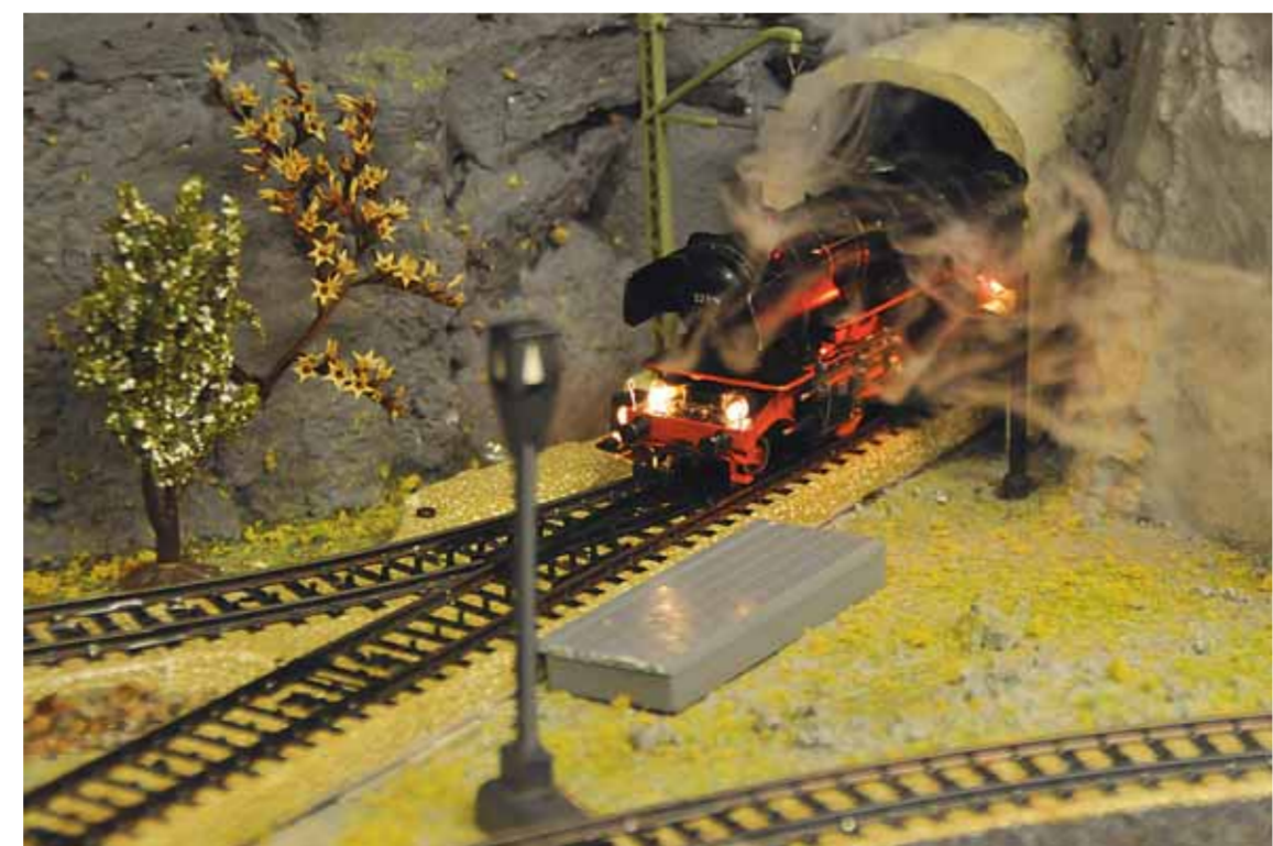
Går du tett innpå, blir miniatyrlandskapet og togene fasinerende realistiske.

– Jeg har tenkt på det, svarer jernbanedirektøren, russlandshjelperen, orienteringsløperen, globetrotteren, regnskapsføreren og ... takk for meg.