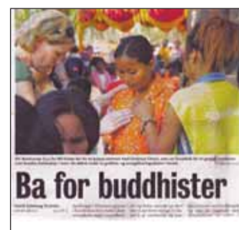
Faksimile fra Vårt Land, som 31. mars hadde en artikkel om aksjonen i Kambodsja.