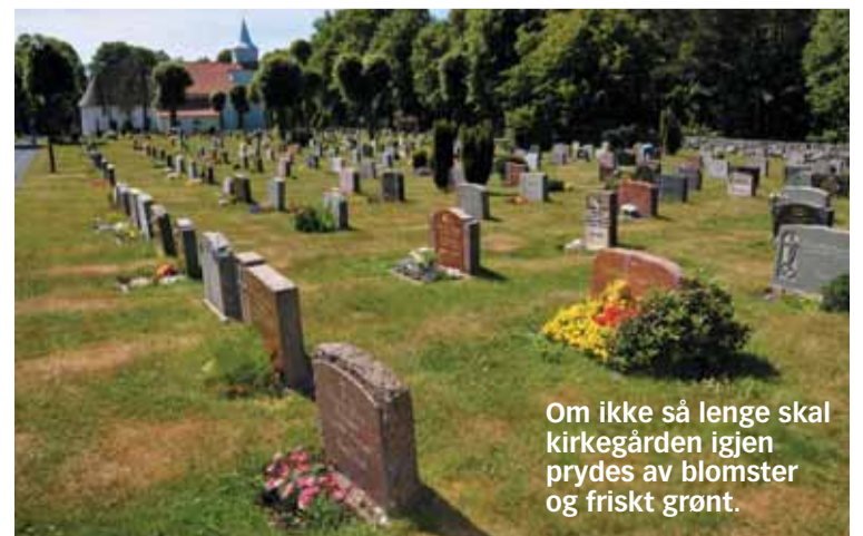
Om ikke så lenge skal kirkegården igjen prydes av blomster og friskt grønt.

– Jeg hadde gjerne sett at vi fikk til mer på informasjons- og guidesiden. Det skulle vært enklere for besøkende å få informasjon om stedet og historien. Det er veldig bra at vi har guider som kan vise rundt grupper, men det skulle vært mulig også for enkeltbesøkende å lese eller lytte seg til informasjon om Fjære kirke når de kommer hit.