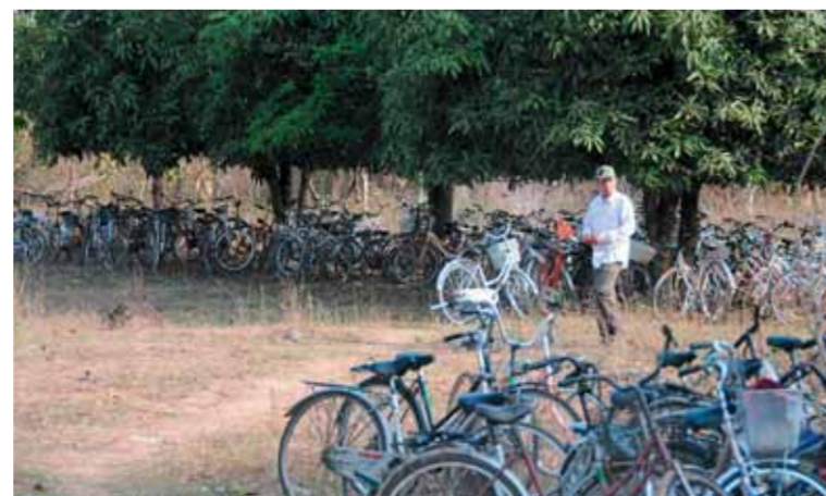
Imponerende av en i utgangspunktet fattig kirke å gjennomføre en prikkfri festival. Gi middag til over 5000, ordne sikekrhet og parkering. Her fra sykkelparkeringsplassen.