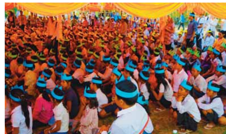
Fra en av aksjonsdagene. Et lokalt team fra Phnom Penh holder søndagsskole for 800 barn i en landsby.