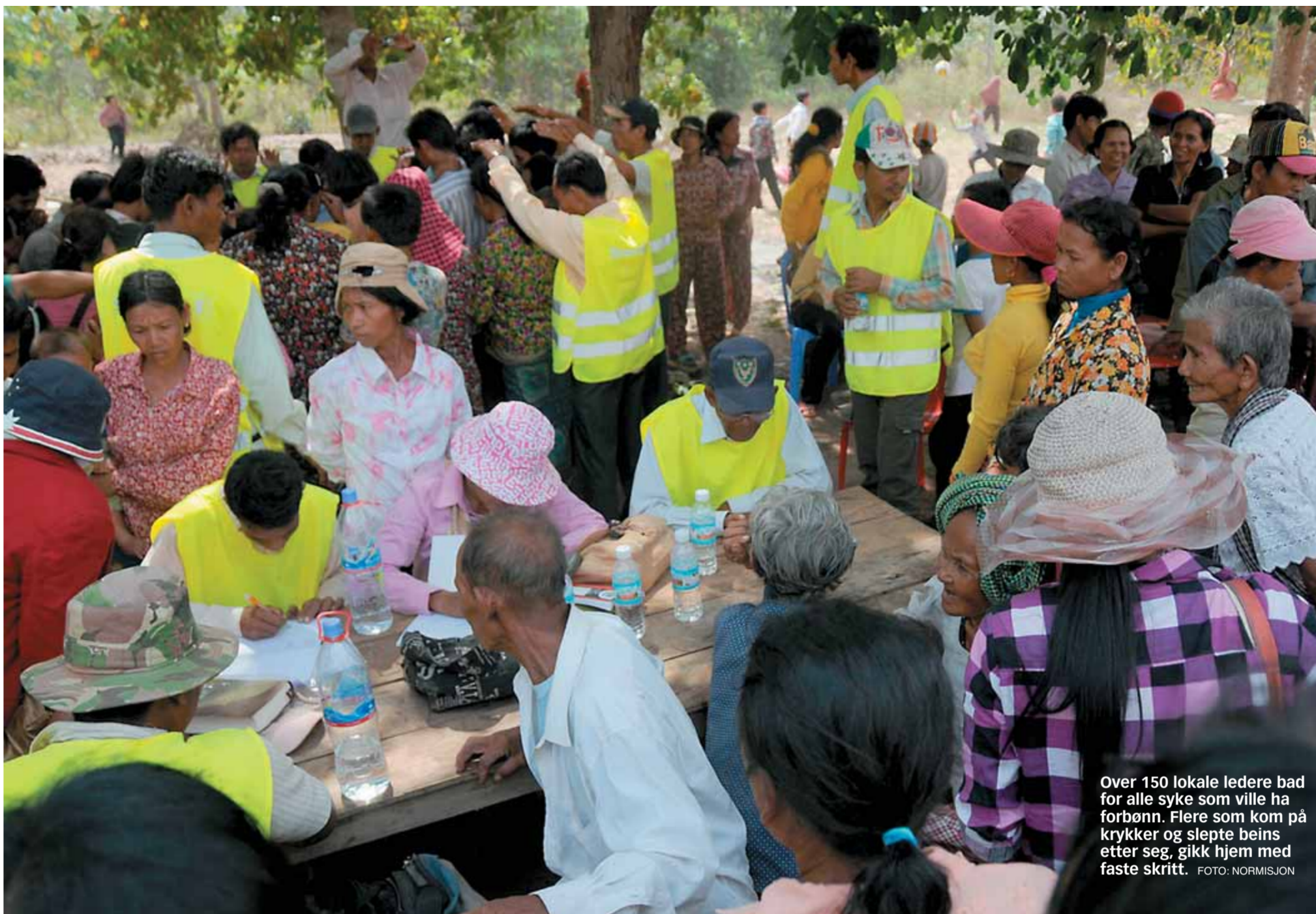
Over 150 lokale ledere bad for alle syke som ville ha forbønn. Flere som kom på krykker og slepte beins etter seg, gikk hjem med faste skritt.

Fra 7-12 hadde et team med lokale et fantastisk opplegg for barna, hvor de fikk opplæring i tannpuss og var med på sang med kristent innhold,