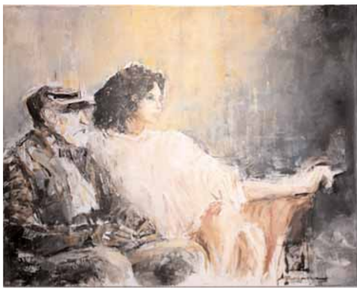
Et av bildene Arild Andresen var representert med i 2010