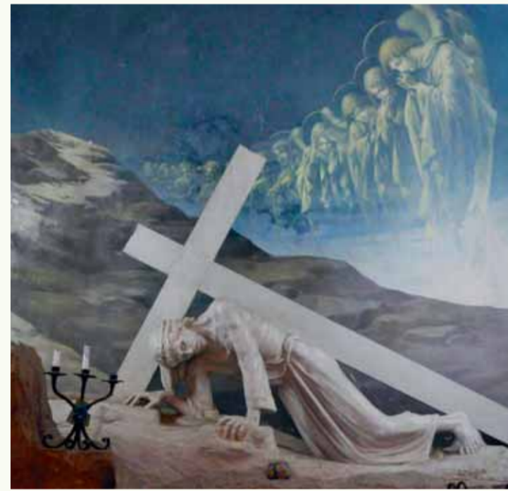
Over: Tablå fra kirken som markerer stedet hvor Jesus falt tredje gang.

Fredag kveld var gamlebyens gater tilsynelatende fulle av ortodokse jødiske menn og gutter i sin karakteristiske klesdrakter. De kom fra Klagemuren. Det var kvelden før sabbaten. Konfirmantene skulle følge sporene etter Jesus, Via Dolorosa, veien som ender på Golgata.