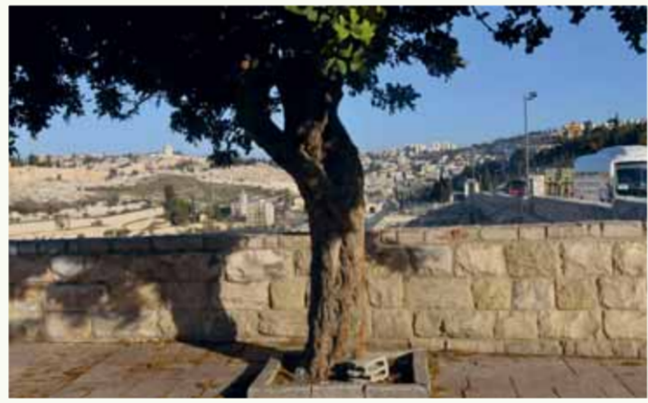
Over: To herrer i gårdsrummet utenfor en koptisk kirke. Under: Utsikt mot Getsemane t.h. og Kedron-dalen nedenfor og gamlebyen på høyden t.v.

berget ser en restene av Getsemanehagen, med eldgamle trær. Helt nede i dalbunnen rant engang Kedron-bekken, som Jesus krysset sammen med disiplene da han etter det siste måltidet gikk til Getsemane for å være alene og be.