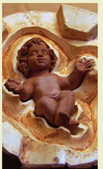
Resultatet etter oppholdet i ovnen, nå gjenstår fargene som skal pryde Jesusbarnet og krybberne han skal ligge i.

Ikke nok med at det siste søndag i november ble åpnet et gedigent julemarked i gatene. Klokkene 10.30 denne formiddagen fylles den katolske reformasjonskirken av mennesker som ønsker å feire årets «santons» på ekte katolsk vis. Kirken rommer mange hundre mennesker, og den er fylt til siste ståplass helt bak. Her blir disse små, men svært så viktige julefigurene, vel-signet. Alle er i feststemming, ikledd provençalske drakter. Et opptog gjennom byens gater er det klare bevis på at jula nærmer seg og jakten på julekrybba kan starte.