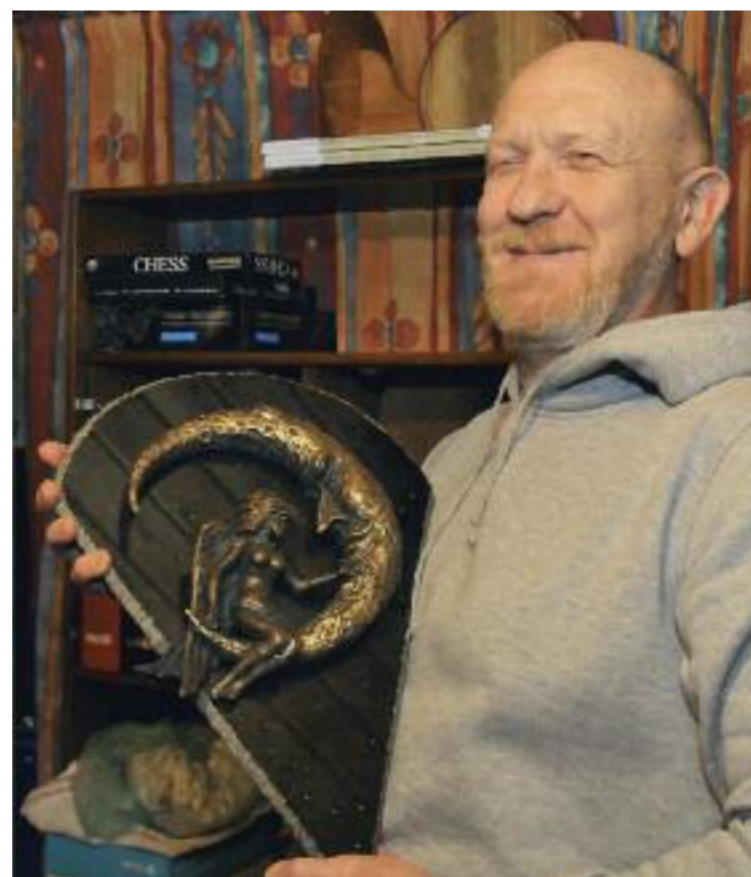
Dette relieffet er fra islamsk mytologi

blåserdrakt. En slik drakt har en luftkran på ryggen; den fikk han slått inn i korsryggen, med sprukket ryggvirvel som resultat. I tillegg plages han av krystallsyke, så til tider er det en utfordring å bevege seg. En behandler som skulle prøver å fikse ryggen, gjorde bare vondt verre.