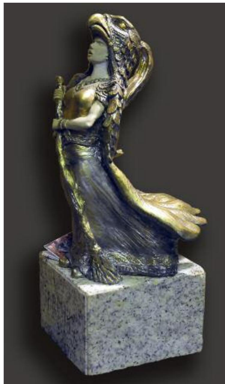
Skulpturen av Frøya er Arnfinns tolking ut fra en bitteliten flatklemt sølvnål fra Sverige. En av Arnfinns egne favoritter.

– Jeg blir ikke millionær av dette, understreker han. Tvert imot har han fått betale med en arbeidsskade. Under arbeid som sandblåser i Hagesund falt han baklengs ned over en rørlens iført sand-