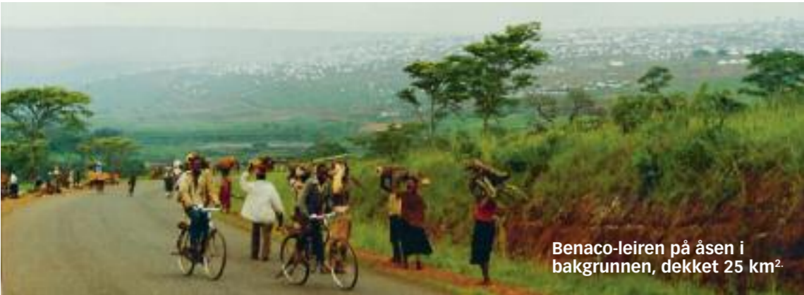
Benaco-leiren på åsen i bakgrunnen, dekket 25 km²