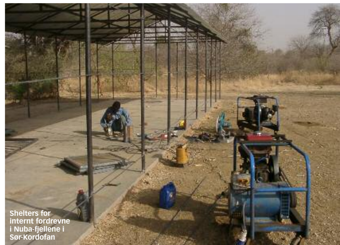
Shelters for internt fordrevne i Nuba-fjellene i Sør-Kordofan