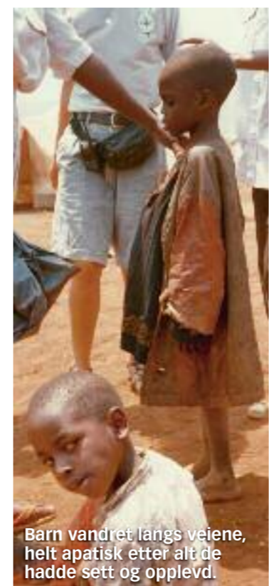
Barn vandret langs veiene, helt apatiske etter alt de hadde sett og opplevd.

– Vi transporterte jo en masse mat, bl. annet ris i sekker. Under lasting og lossing blir det alltid noe spillkorn. En dag så jeg ei gammel dame, fra lo-