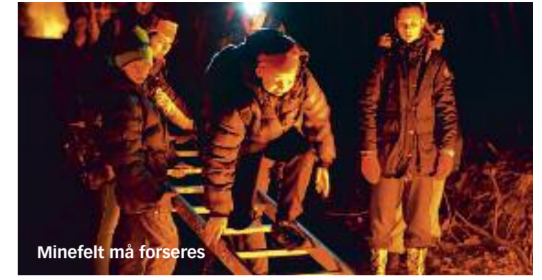
Minefelt må forseres