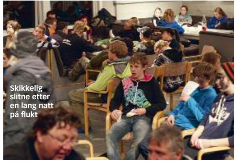
Skikkelig slitne etter en lang natt på flukt