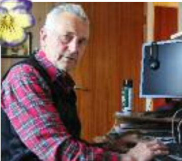
Stein har enda mye på hjertet, men det må bli til memoarboken han har begynt på.

Vi rusler ut i hagestua hvor han har samlet en del jaktminner og gjenstander fra Afrika. Straks er han i full gang med å fortelle nye historier, om et liv ute i bushen, rundt bålet etter jakten, om stillheten og lydene, fellesskap og vennskap. Joda, han har fått syken, og blir nok ikke kvitt den; Afrika-syken. •