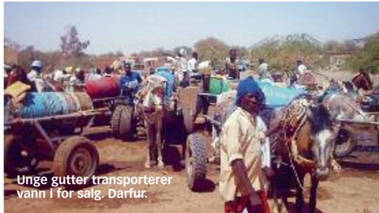
Unge gutter transporterer vann i for salg. Darfur.

– Det var mye arbeid, så vi jobba 7 dager i uka. De kristne hadde fri på søndag, og muslimene fri fredag. Så det var praktisk. Her gikk arbeidet for fullt hver dag hele uka gjennom. Det siste jeg gjorde var å sveise ferdig porten selv, da leirbyggingen var fullført.