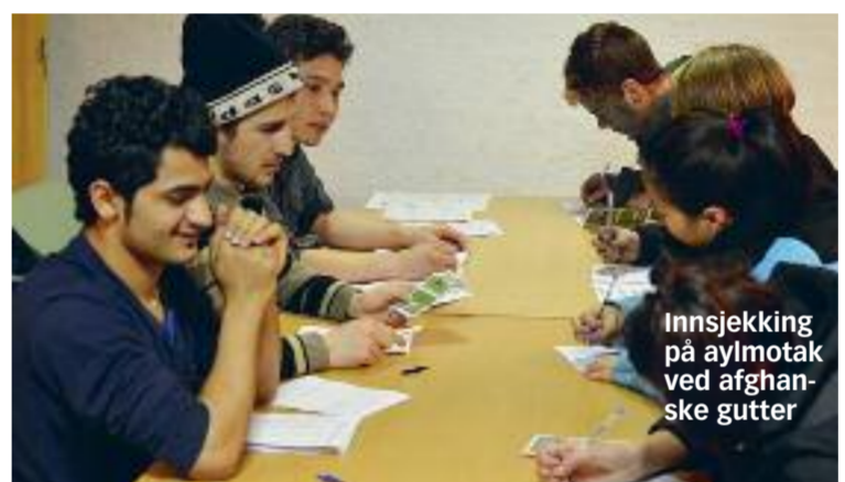
Innsjekk på asylmottak ved afghanske gutter