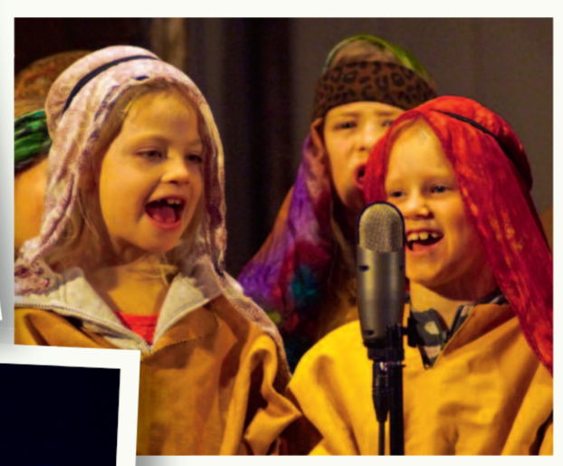
-Fotografiske glimt fra julespillet «Like til Betlehem» på julaften i Fevik kirke, og fra Julenattinéen i Fevikhallen 22. desember.