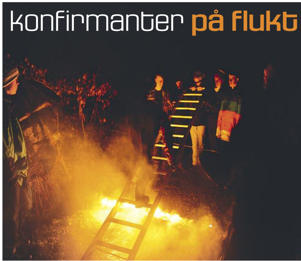
Minefeltet måtte forseres.

Erfaringen at det er slitsomt å være flyktning, er en verdifull er erfaring å ta med seg videre, når holdninger og meninger skal formes og utfordres.