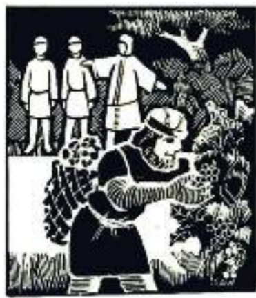
Illustrasjon: Svønn A. Hansen

«Har jeg ikke lov til å gjøre som jeg vil med det som er mitt? Eller ser du med onde øyne på at jeg er god?»