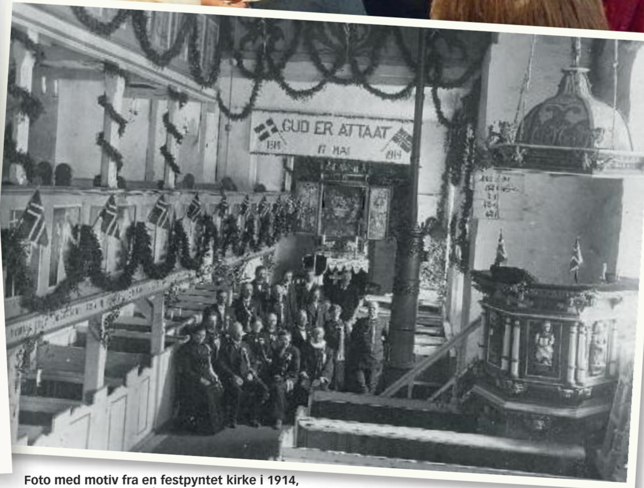
Foto med motiv fra en festpyntet kirke i 1914. Det var med i hundreårs-tidskapselen.

Det går mot slutten av jubileumsåret. Skulle ikke vi også tenke ut noe å overlevere til de som er her når det har gått enda et hundreår? Hva vil vi si til dem? Hva skal være vår hilsen til fremtiden? Kanskje har de nok av skrift og bilder fra vår tid, om ikke en katastrofe vi er lykkelig uvitende om, har slukt alt... Men om det fortsatt skulle være noen her som kan lese det vi skriver, vil de kanskje være vel så interessert i hva vi tenkte og følte idag, hva vi holdt for stort og kjært og verdifullt. Om «utviklingen» går like rasende fort som den har gjort på mange områder i vår tid, vil det være enda rarerer for dem som åpner vår tidskapsel enn det var for oss å åpne den fra hundre år siden. Verden og Norge og Fjære i 2114 er uvirkelig for oss og vanskelig å tenke seg. Men menneskehjertet vil ganske visst være det samme. I dypet også hos dem vil det fortsatt skjelve vare strenger av tro, håp og kjærlighet som vil være i