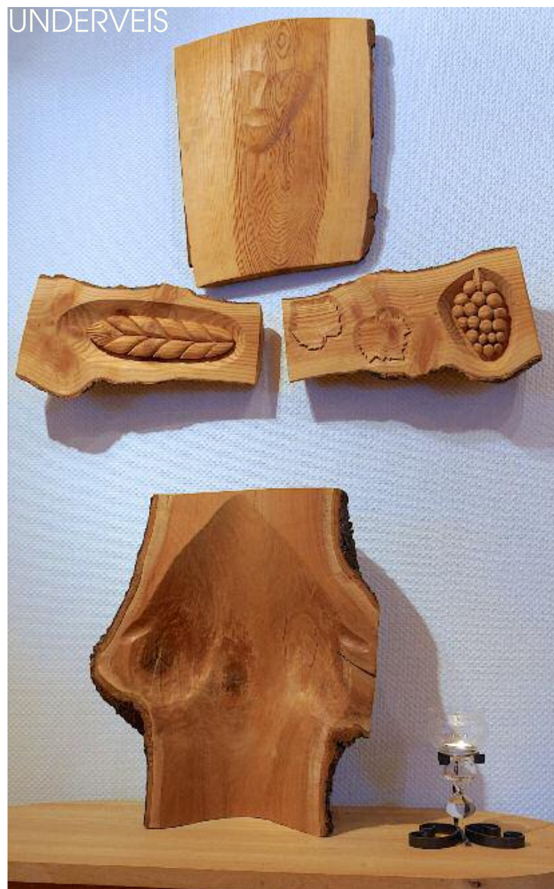
NATTVERDSYMBOLENE i sine opprinnelige former, og mysteriets skjulte nærvær, vist som et ansikt og to åpne hender. Et greinfeste i hver hånd taler for seg.