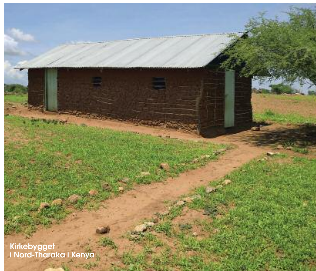
Kirkebygget i Nord-Tharaka i Kenya

En annerledes og interessant bok om deler av Norges historie og om kysten som pilegrimsled.