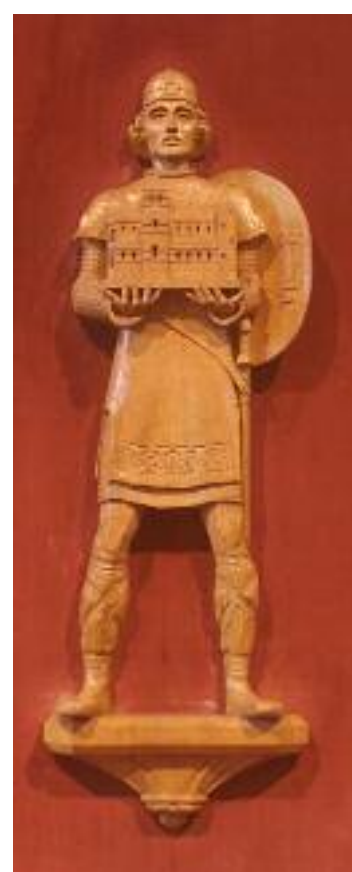
St. Ragnvald startet byggingen av St. Magnus-katedralen i Kirkwail på Orknøyene