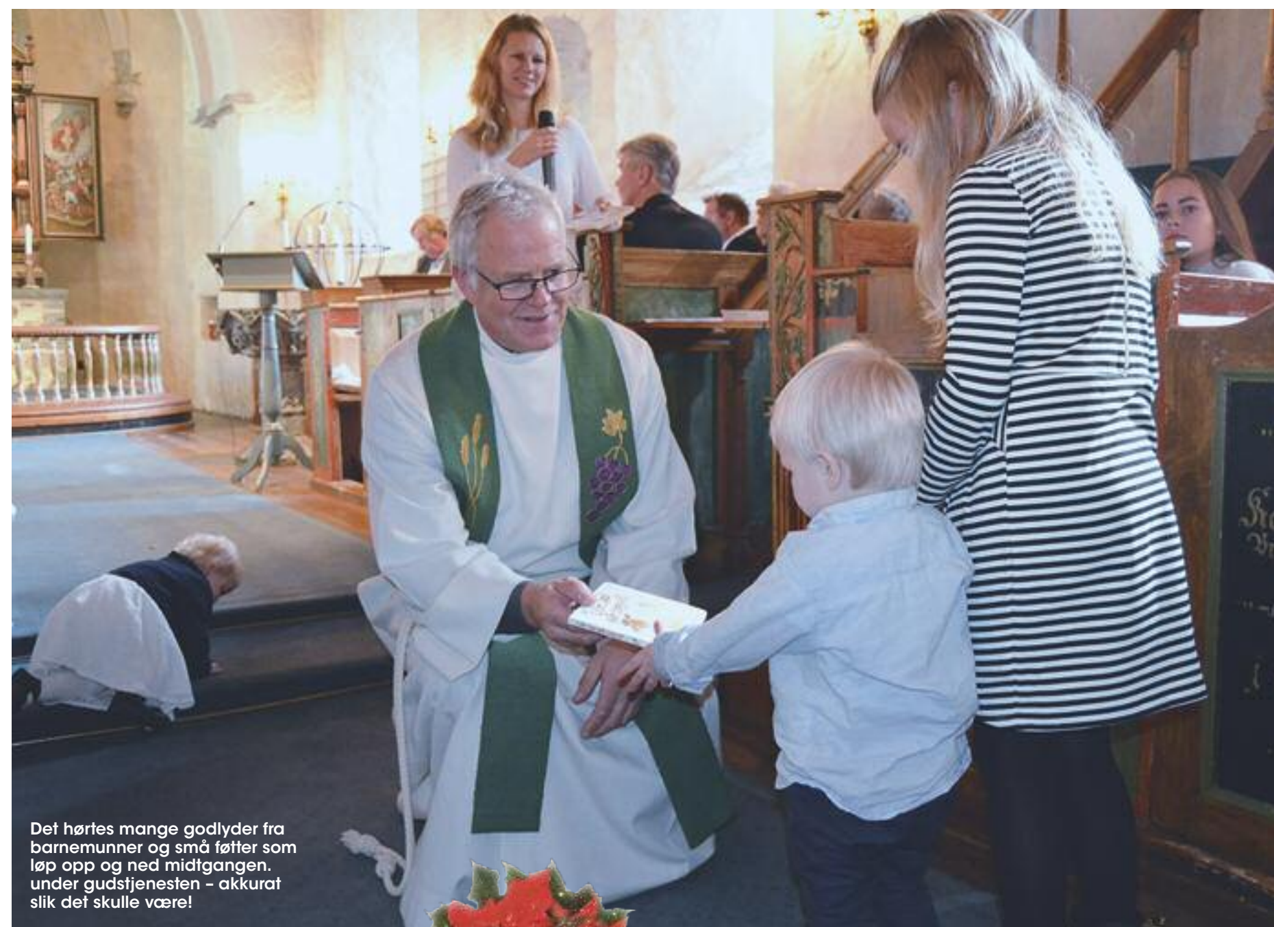
Det hørtes mange godlyder fra barnemunner og små føtter som løp opp og ned midtgangen. under gudstjenesten – akkurat slik det skulle være!