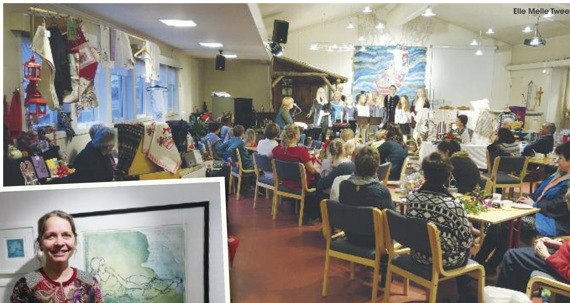
Elle Melle Tween

To av de store og tradisjonelle arrangementene i Fevik kirke i høst var Kunst- og kulturuka i oktober og Julebasaren (den tidligere Julemessa) i desember. Begge arrangementene samlet mye folk. Det ble solgt mange bilder under kunstutstillingen, som betyr kjærkomne midler til Haydom hospital i Tanzania. Hvor mye vites ikke i skrivende stund. Det samme gjelder resultatet av basaren. Også disse midlene vi i sin tur fordeles på gode formål, både i og utenfor menigheten.