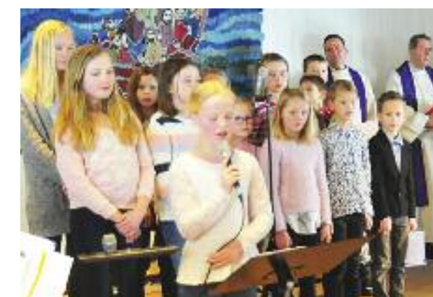
Elle Melle Tween hilste presten velkommen med sin friske og engasjerte sang.

Samtidig er et presteskifte en gylden anledning til å stoppe opp litt og stille noen kontrollspørsmål. Hvorfor gjør vi det vi gjør, og hvorfor gjør vi det slik vi gjør det?