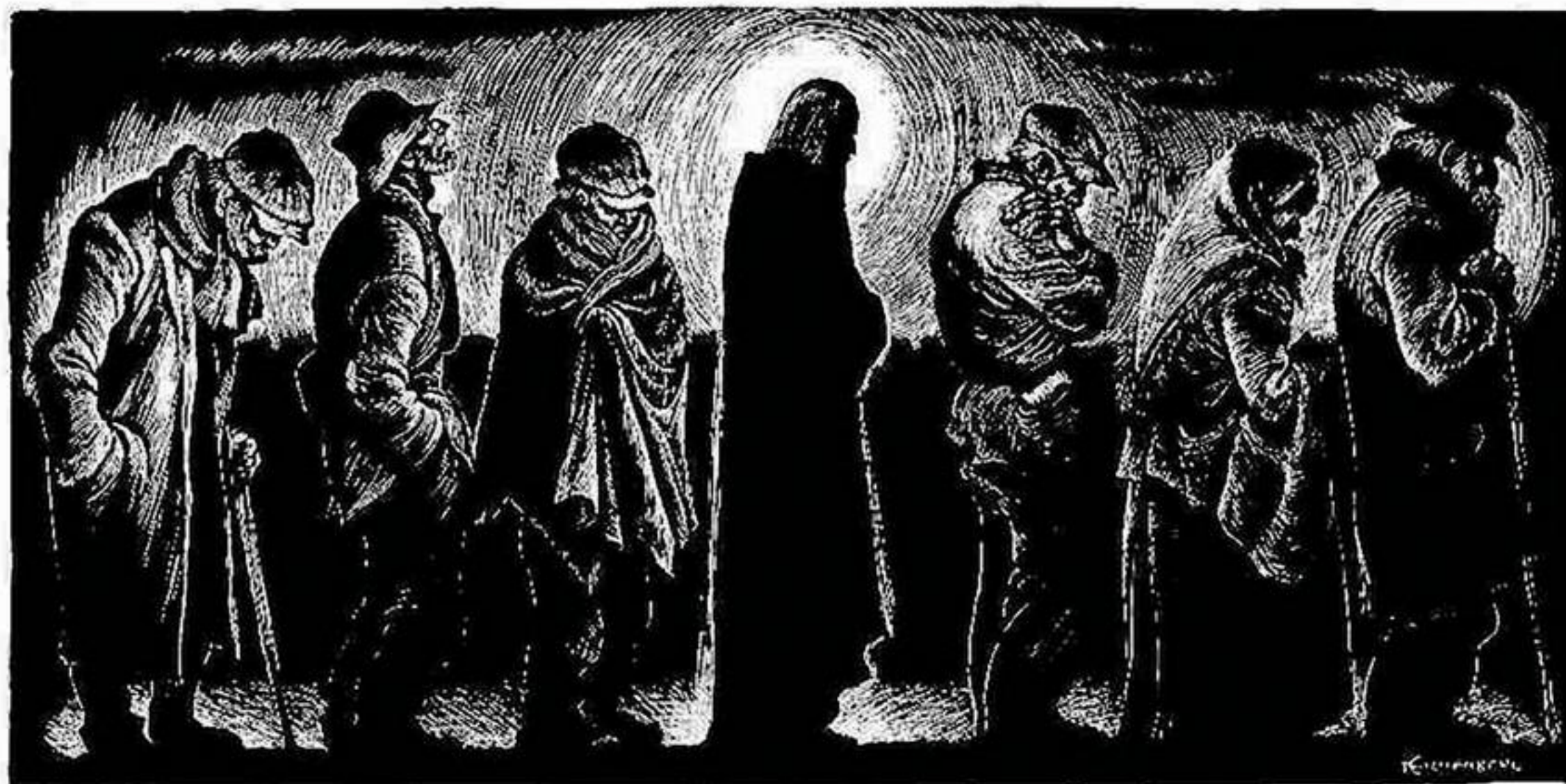
Fritz Eichenberg's tresnitt fra 1951 med tittelen «The Christ of the Breadlines» — «Matkø-Jesus». ( Les mer: http://www.reliefjournal.com/2015/04/10/fritz-eichenberg/ )

De trengte seg omkring Kristus. De ville være så nær ham som mulig. Og selv om han ikke sa noen ting, fikk de likevel svar på spørsmålene sine. Svarene fantes i ham og rundt ham. Den fine byen ble knet bort. Det betydde ikke noe lenger om gatene var rette eller krokete. Bilenes standardfarger kunne ikke måle seg med fargene på de blomstene som sprang ut rundt Kristi dansende føtter. På noen sekunder var det meste av de