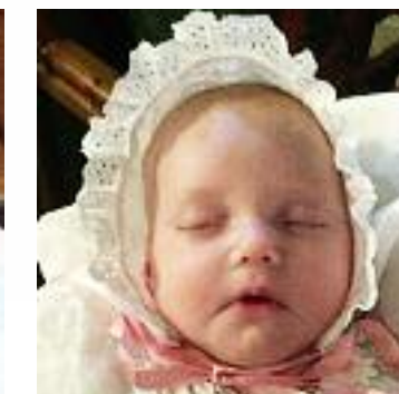
NN Døpt i Fjære kirke