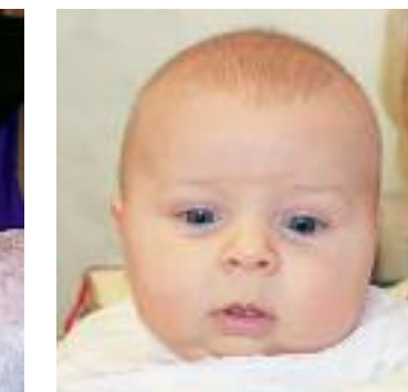
NN Døpt i Fjære kirke