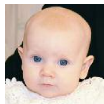
NN Døpt i Fjære kirke