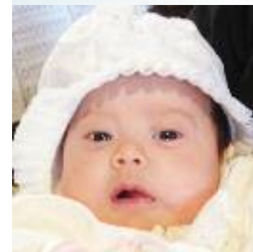
NN Døpt i Fjære kirke