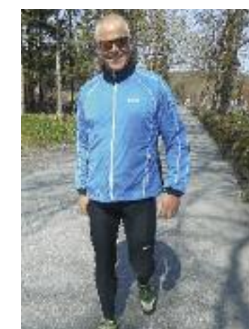
Sognepresten tok flest runder i løypa.