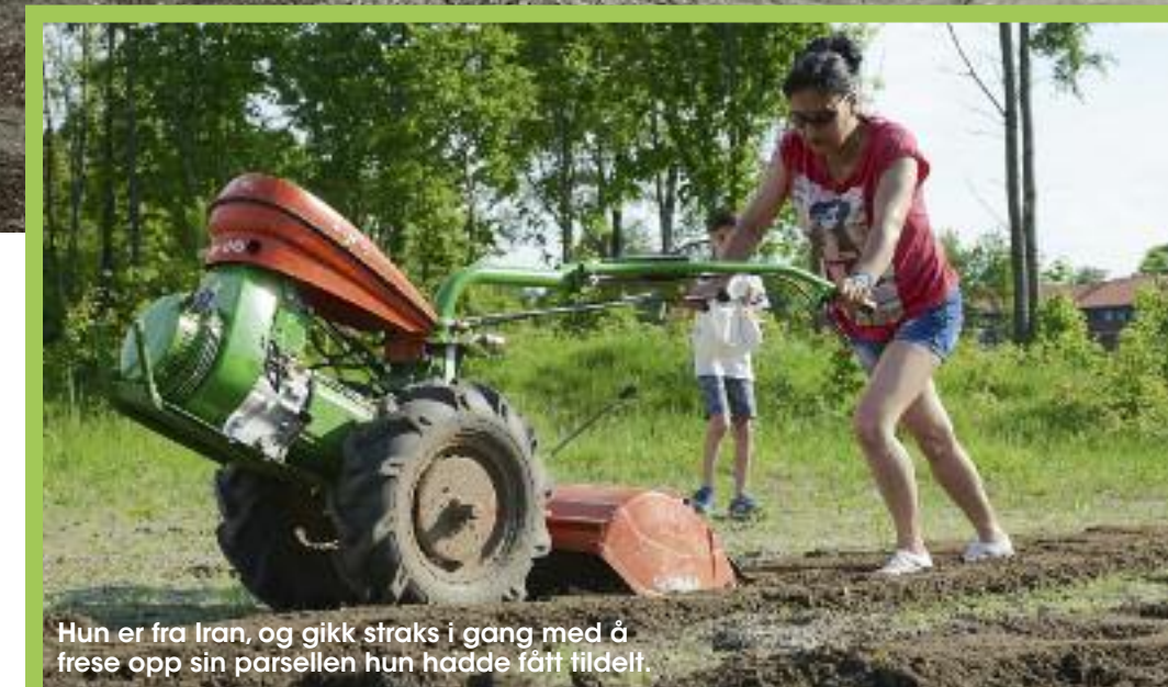
Hun er fra Iran, og gikk straks i gang med å frese opp sin parsellen hun hadde fått tildelt.

Fordi tilstrømmingen til Norge ble ekstra stor i 2015 sa Grimstad kommun ja til å ta imot 71 flyktninger mot de planlagte 45. Summen av politisk velvilje, dyktige medarbeidere på Flyktningekontoret, og en stor gruppe frivillige som har engasjert seg i integreringsarbeidet, har agjort at bosettingen i Grimstad langt på vei fortjener benevnelsen «en suksesshistorie».