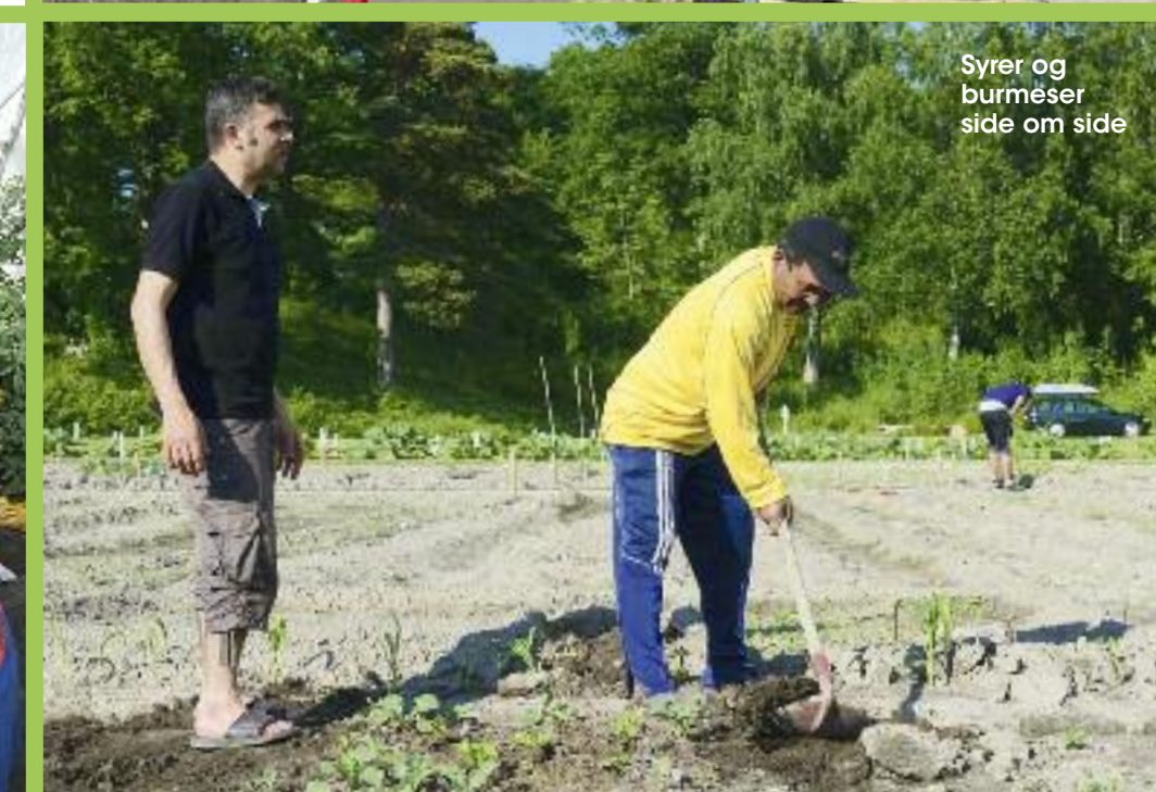
Syrer og burmeser side om side