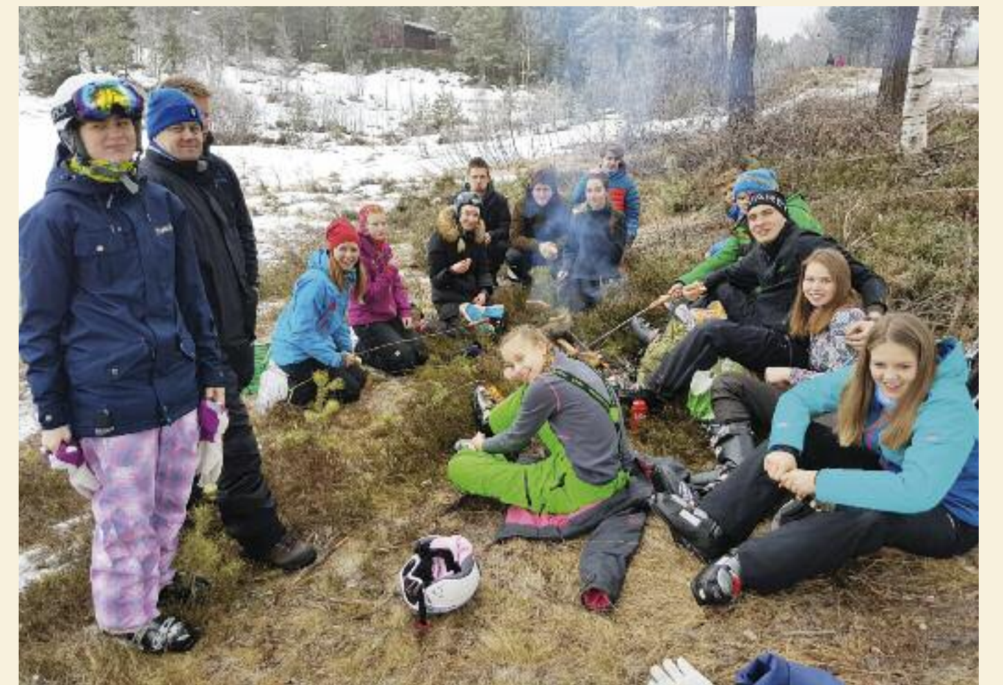
Her er det mye høy kompetanser på å hygge seg SAMMEN på tur! Lite snø på vintertur er ingen hindring!