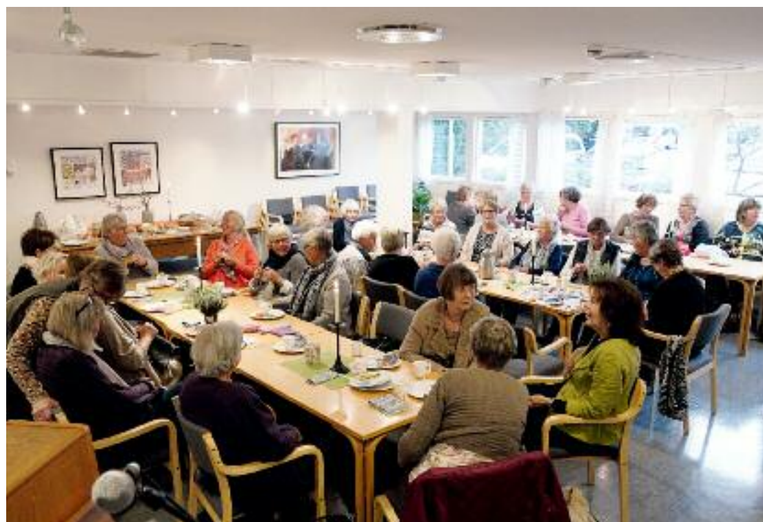
Strikkekaféen har ikke holdt på så mange år, men har på kort tid vokste i til en stor gruppe.