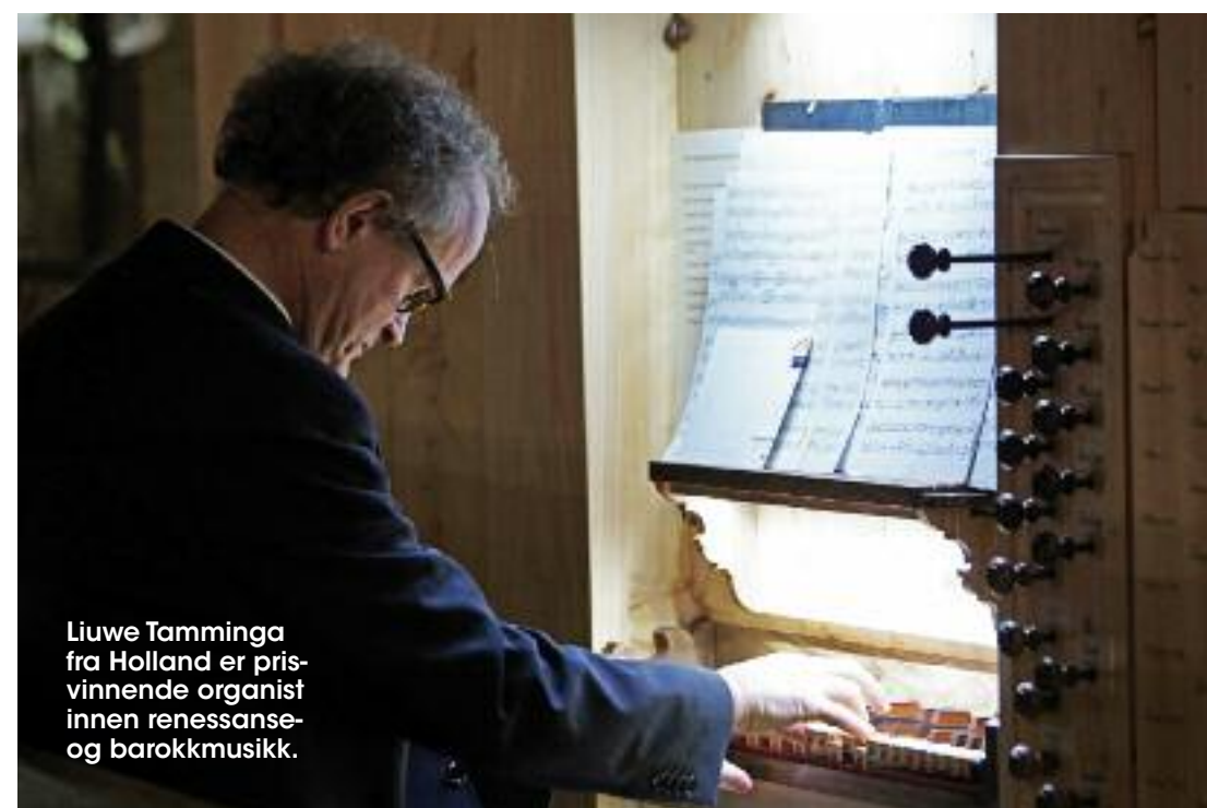
Liuwe Tamminga fra Holland er prisvinnende organist innen renessanse- og barokkmusikk.