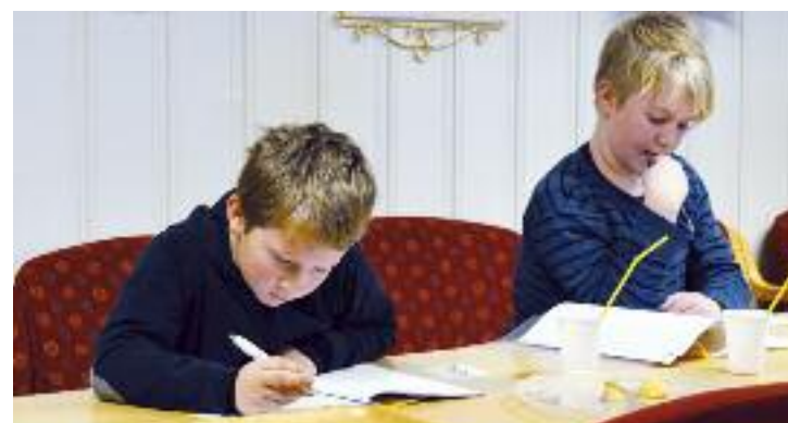
SLUSH står for Sprell Levende Unge Søndagsskole-Hjelpere, og det kan se ut til å stemme ganske bra. Men de konsentrerer seg når det skal studeres (under t.h.)