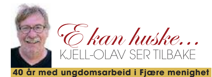
40 år med ungdomsarbeid i Fjære menighet