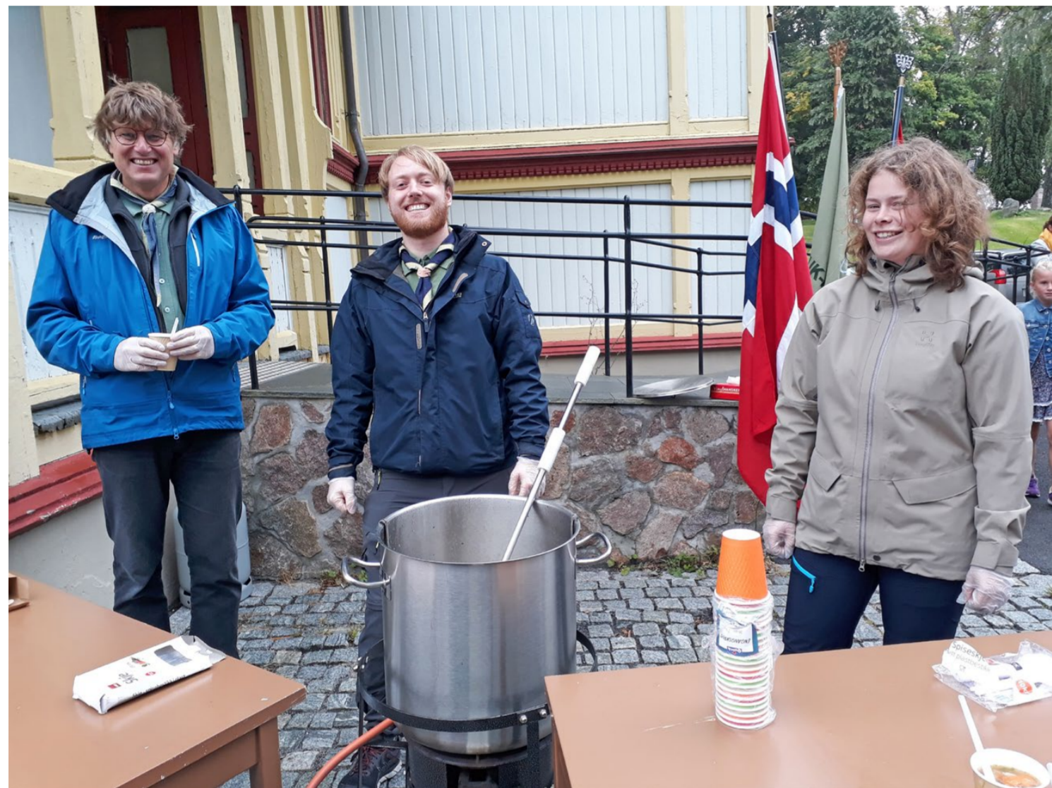
KIRKESUPPE: Speiderne serverte ertesuppe på kirkebakken.

Søndag 13. september var det høsttakkegudstjeneste i Grimstad kirke. Speiderne deltok i gudstjenesten og det var presentasjon av nye konfirmanter.