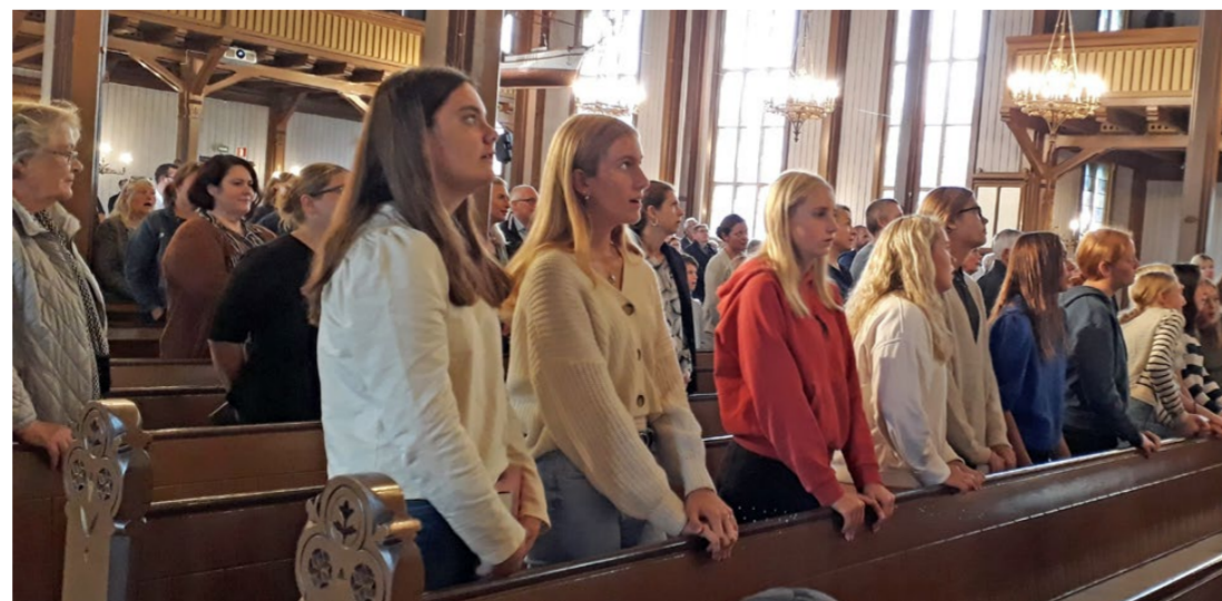
KONFIRMANTER: Konfirmanterne fylte opp to benker i kirken.