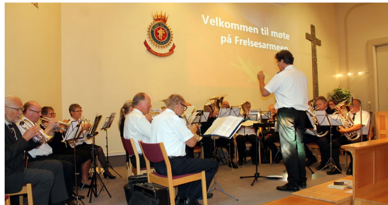
FRELSESARMEENS HORNORKESTER: Deltar på salmekveld i Grimstad kirke torsdag 15. oktober.