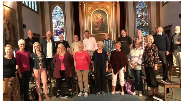
GRIMSTAD KIRKEKOR: Synger sanger av Gabriel Scott.