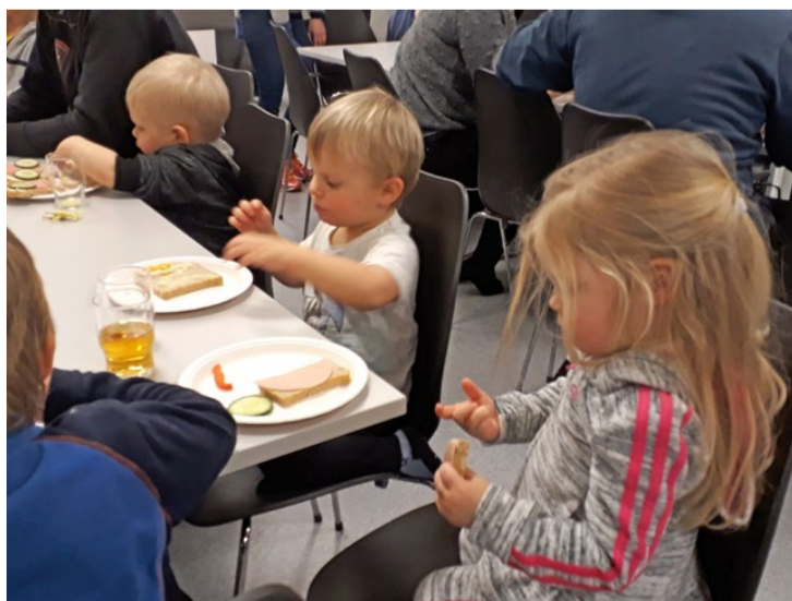
KVELDSMAT: Godt med mat etter den fysiske aktiviteten.