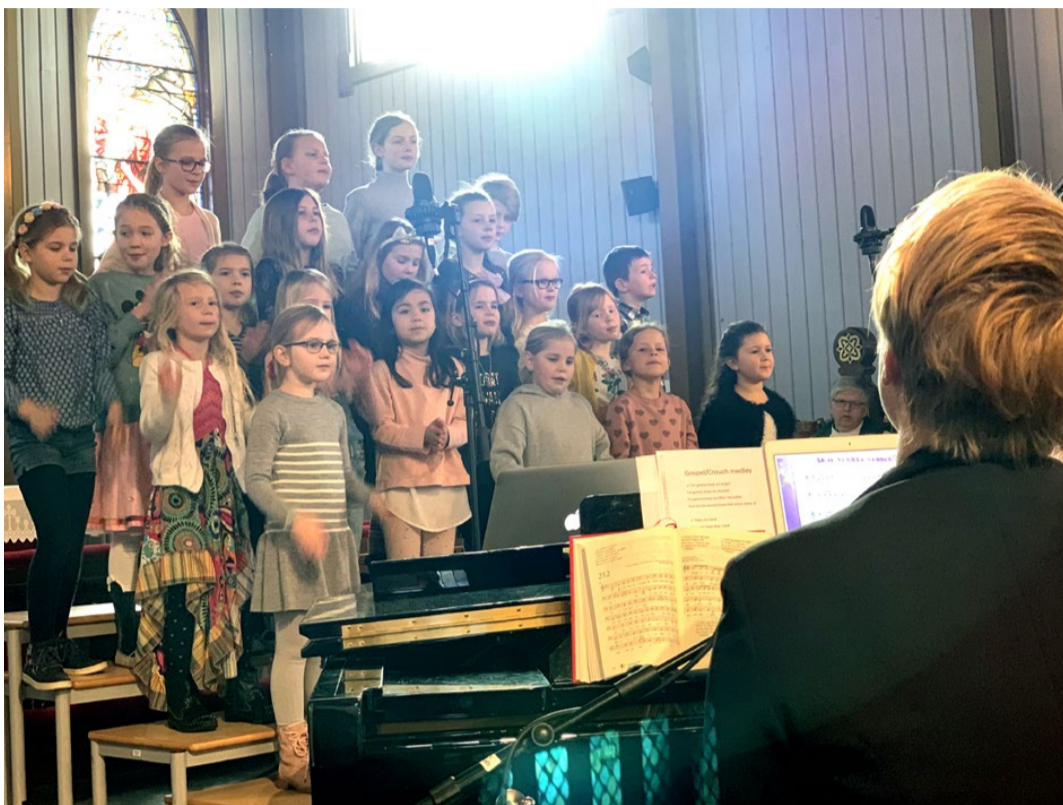
BARNEKOR: Deltakere fra Jappa og Holviga skoler.