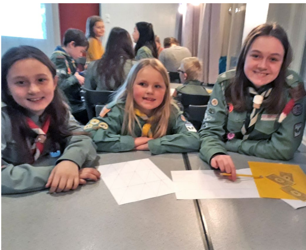
DE FATTIGE: Denne gruppen venter på at noen skal låne dem en saks for å kunne fullføre oppgaven.

Det er en engasjert og midtstors stor speidertropp som samles til møter på Triangelhuset. De har også hatt skøyte- og utedag på Myra og utedag på Dømmesmoen. Det er altså et variert program for KFUK-KFUM speiderne på Triangelhuset og nye medlemmer blir ønsket varmt velkom-