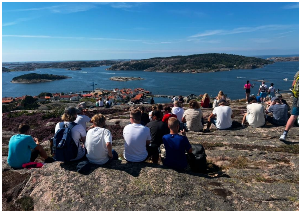
Sommertur til Gøteborg

Turer er en viktig del av Spiren. På turer får vi med oss en kjerne av ungdommer som vi blir bedre kjent med, og får anledning til å gi grundigere undervisning. Gjennom året 2024 har Spiren hatt Vintertur til Bygland, Sommertur til Gøteborg, Blåtur i Landviks natur og Solhøgda tur.