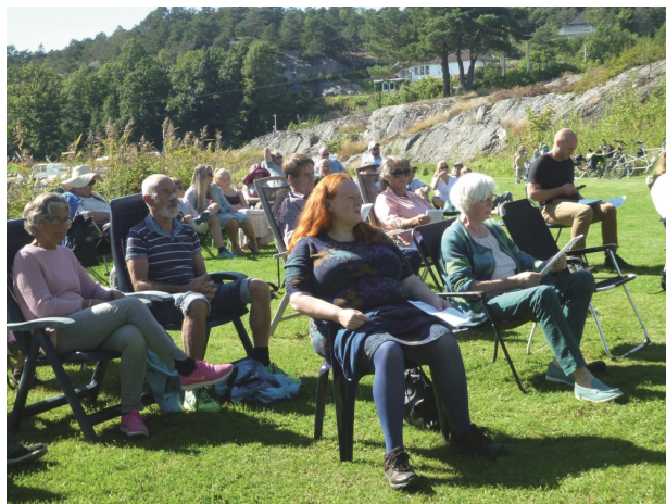
Et lite utsnitt av forsamlinga