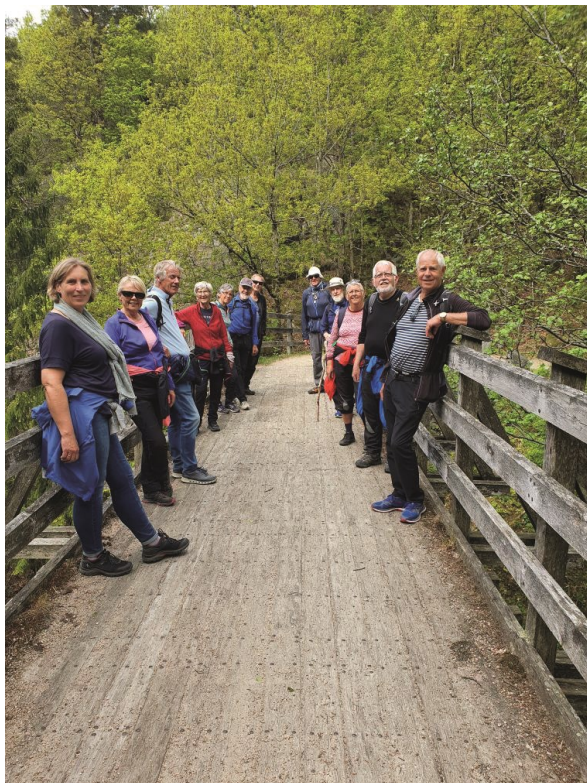
Stopp på Eineid bro på 'Gamle Sørlandske' (kanalen mellom Landvikvannet og Reddalsvannet).

En pilegrim er en som vandrer til et hellig sted som et ledd i en bortsøvelse eller annen form for åndelig trening. I moderne tid er det i tillegg flere og mere sammensatte årsaker til at folk gir seg ut på vandring til Nidaros, Santiago de Compostella, Roma eller mindre ambisiøse mål.