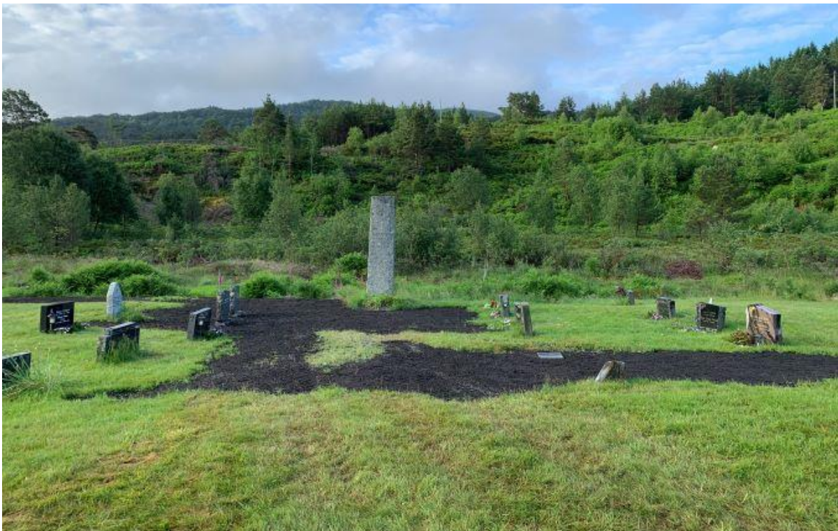
Utbetring og påfyll av jord på Rutle.