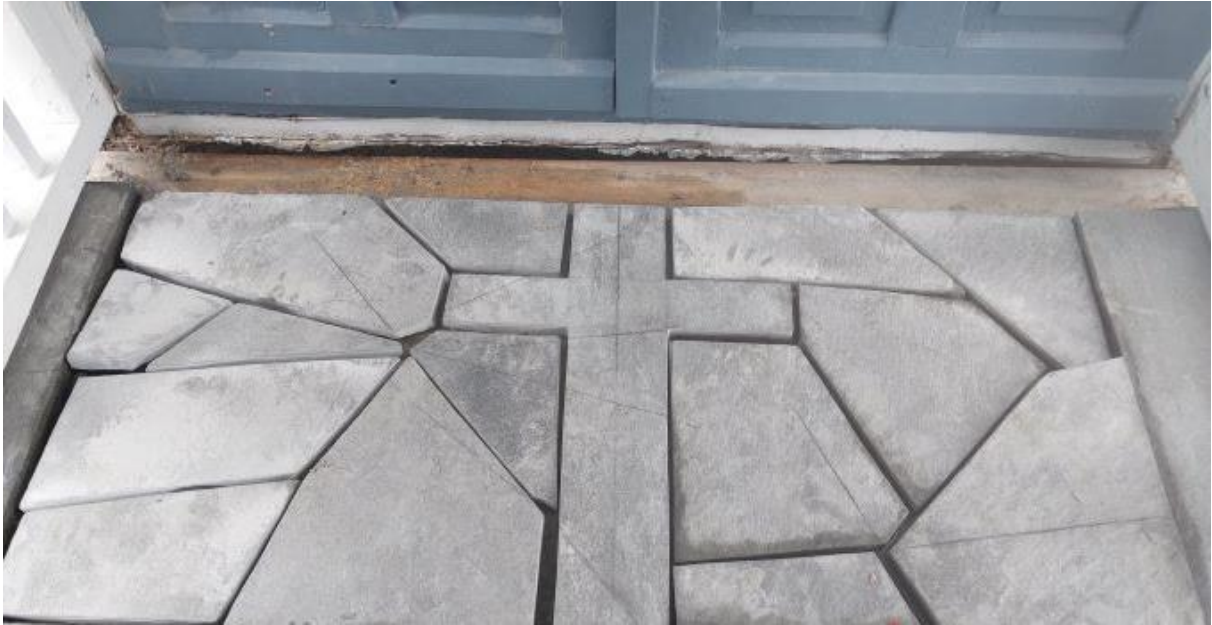
Vakkert inngangsparti frå kyrkjetrappa.