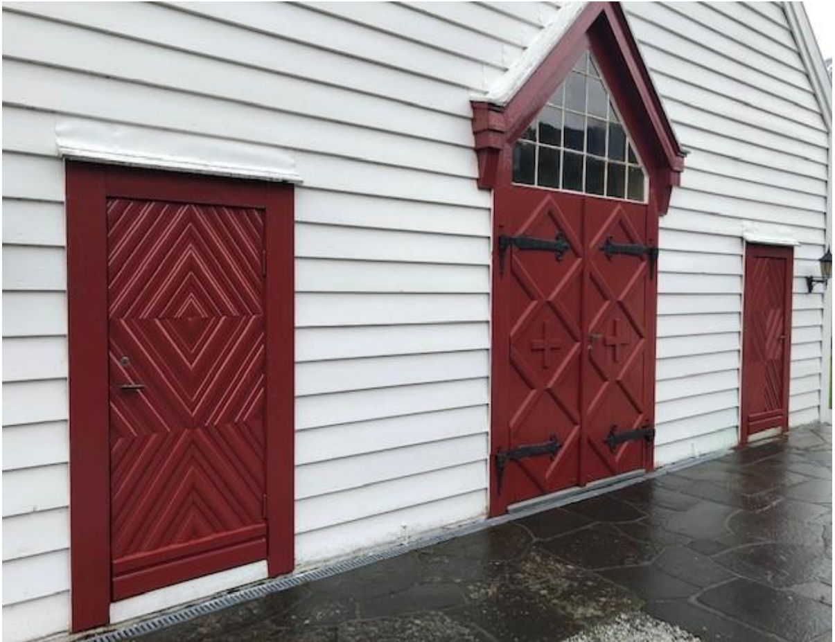
Nymalte kyrkjedører i Brekke.

Det er installert varmestyring i kyrkja som eit tiltak for å få betre kontroll med oppvarminga, utan at ein må møte opp i kyrkja. I forkant blei det bytt ut nokre gamle panelomnar, særleg var den i prestesakristiet moden for utskifting. Hovuddørene i kyrkja og dørene i bårhuset fekk seg eit etterlengta målingsstrøk, dette arbeidet blei utført på dugnad.