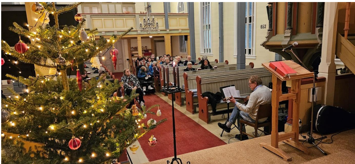
«Vi syng jula inn», Mjømna kyrkje.