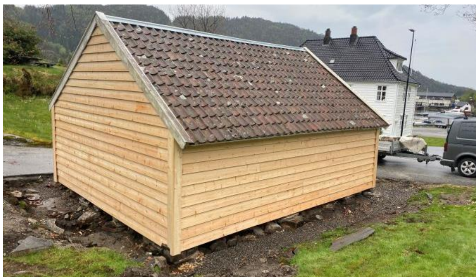
Borgstova med ny kledning, god drenering og oppvatra.