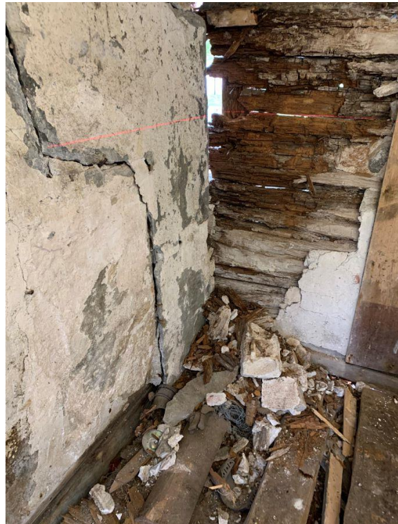
Bilete viser vegger, golv og eldstad i Borgstova før restaurering.