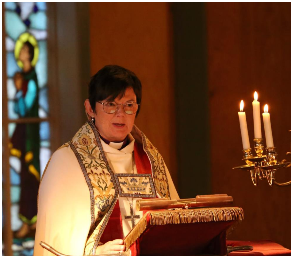
Biskop Ragnhild Jepsen på preikestolen i Gulen kyrkje under jubileumsgudstenesta 25. august 2024. Meir side 8-10.