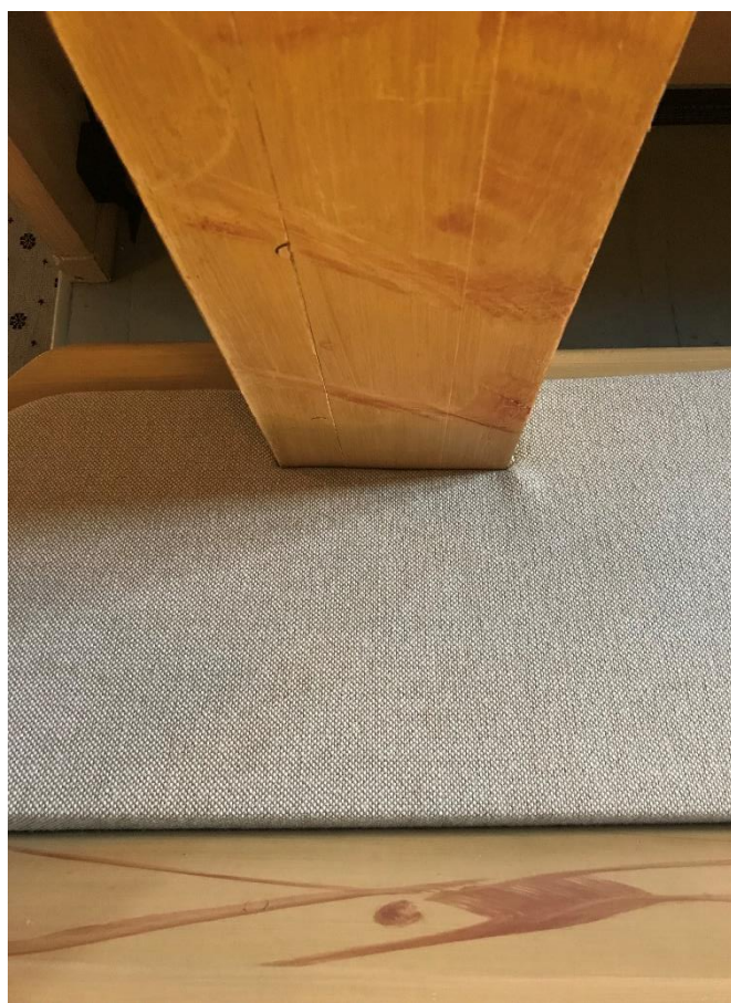
Nye benkeputer i Oddernes i desember