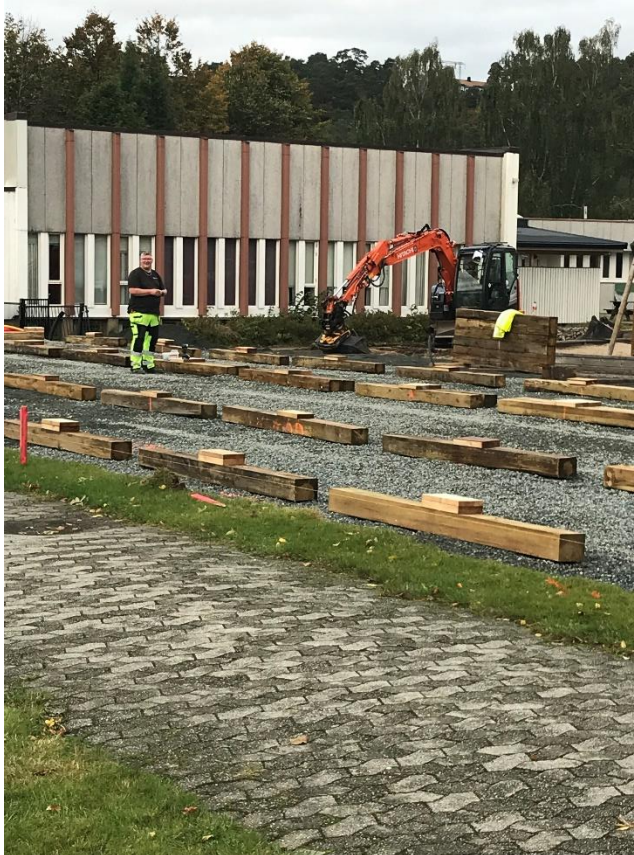
Barnehagen utvides med brakker i oktober 2021.