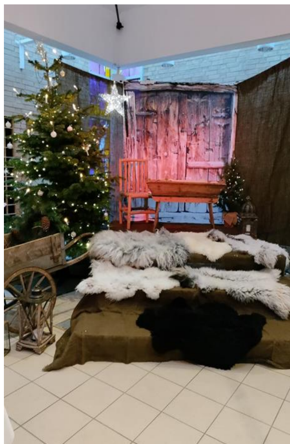
Jul i Justvik kirke