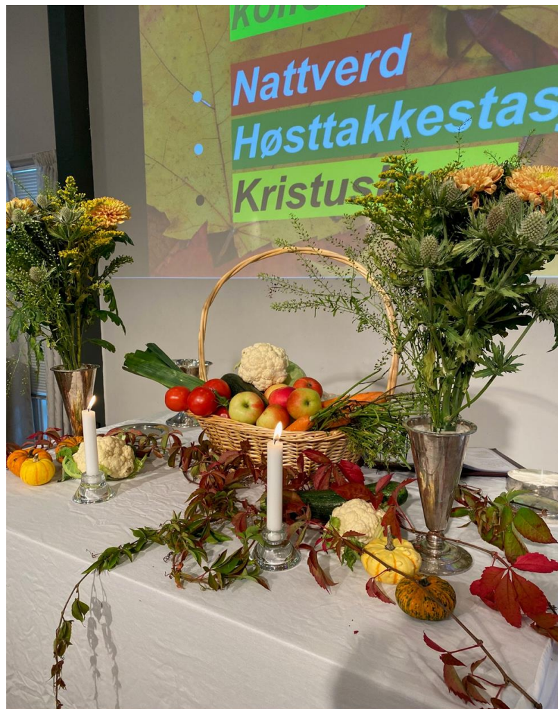
Barnas gudstjeneste i menighetshuset