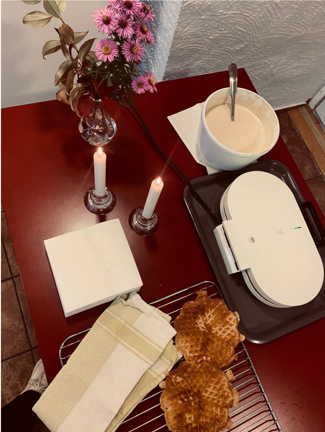
Tirsdagsvaffel på gang 😊

*Gudrun Sødals fond på kr 460.000, hvor renteavkastningen kan disponeres.