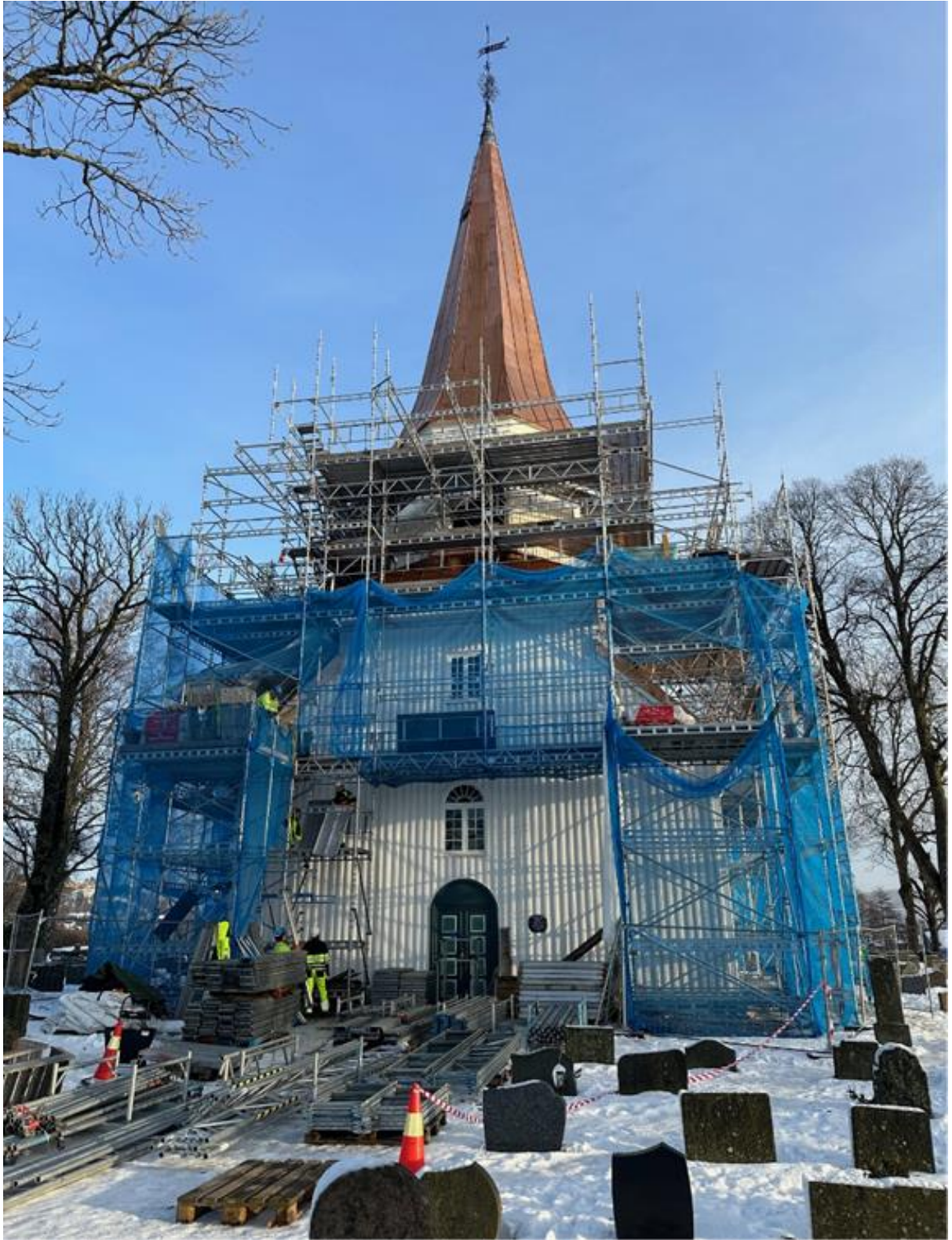
Stillaset tas delvis ned til jul