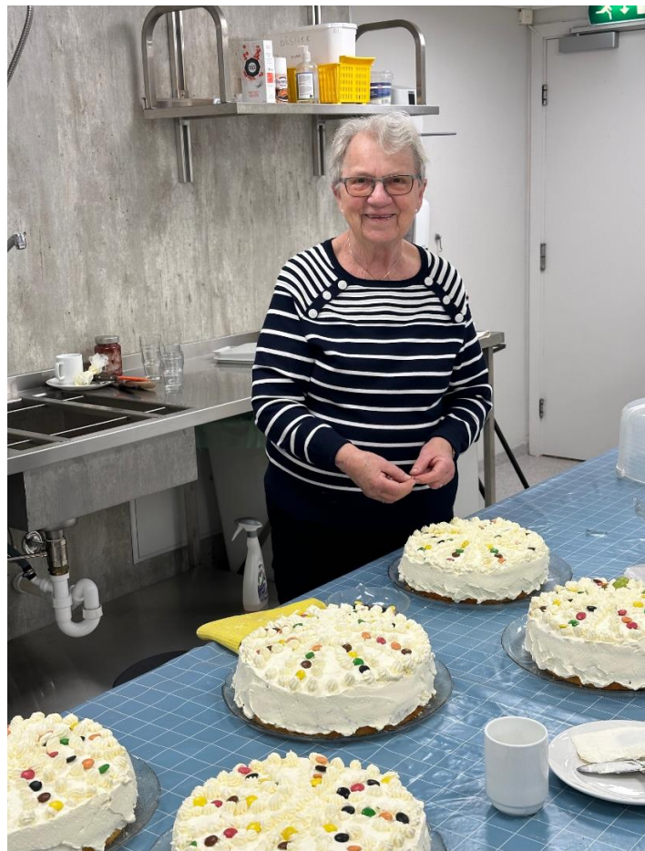
Liv lager bløtkaker til gjestebud