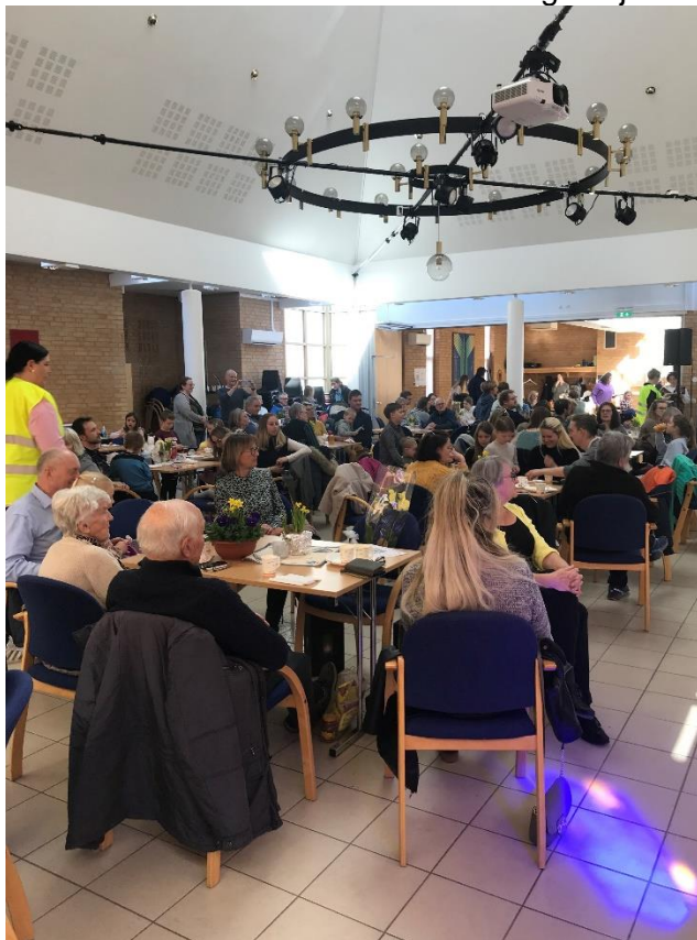
Basar i Justvik 13. mai