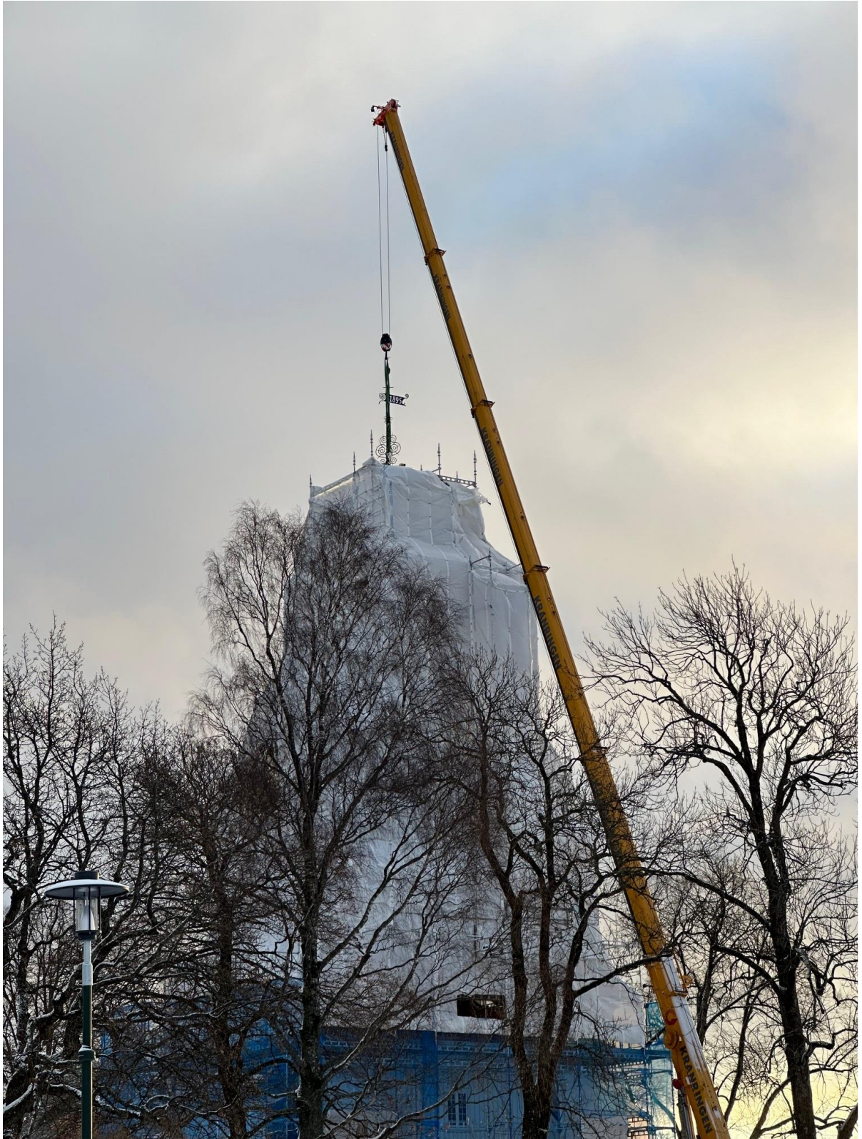
Nyoppusset værhane heises på plass.