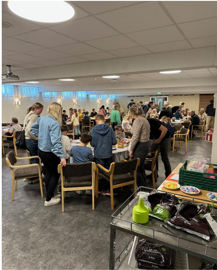
160 personer på Påskeverksted i menighetshuset 18. mars