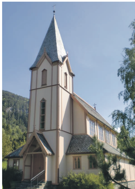
Kyrkjebø kyrkje fekk nytt orgel, og vart måla i 2018.