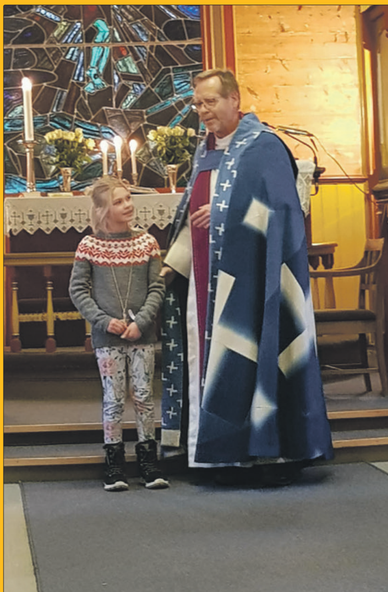
Celine og biskopen.

NR 1, 2020 KYRKJELYDSBLAD FOR SOKNA I HØYANGER KOMMUNE 88. ÅRG