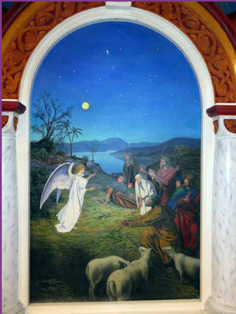
Altartavla i Ortnevik: Foto Ole Ådland

NR 4, 2022 KYRKJELYDSBLAD FOR SOKNA I HØYANGER KOMMUNE 90. ÅRG