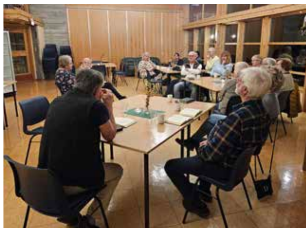
Frå «Mat og prat»