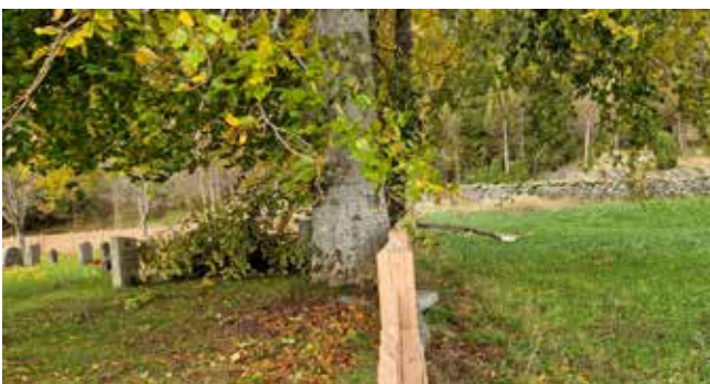
Etter hauststorm på Kyrkjebø .