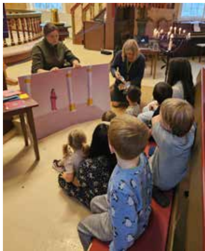
Frå myldresamlinga i september.

På tårnsøndag skal kyrkjelyden ta imot vår