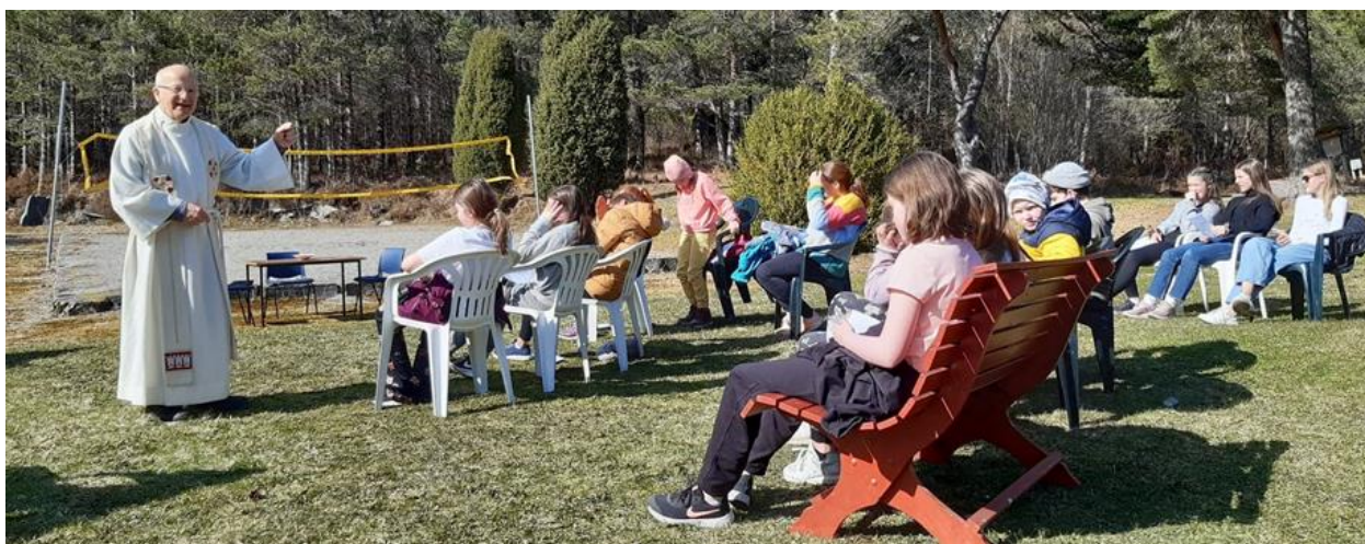
Frå friluftsgudsteneesta på Alværa i samband med leirdag og korona.

lysmessa i 2022 då tema var Jesus som rir opp til Jersuaem på eit esel, og då du under tekstlesinga kom syklande inn i kyrkja.