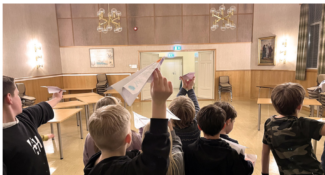
Spennende å teste papirflyene.

De eldre barna kan komme til «Et sted å være» første lørdag hver måned fra kl.19.00. Her kan man starte det året man begynner i 7. trinn.