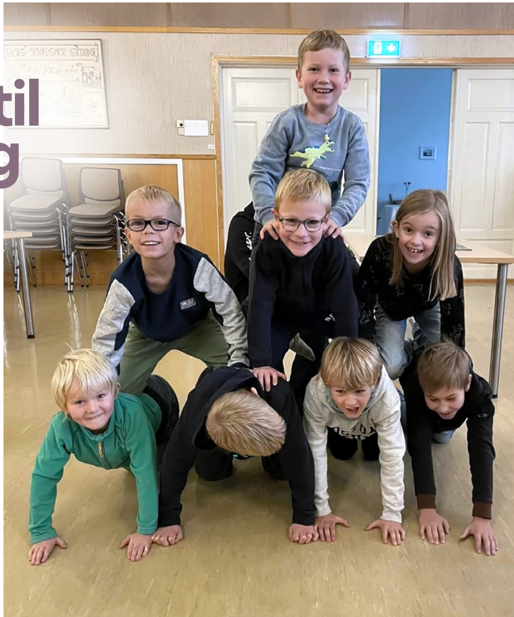
Har vi det ikke hyggelig, sier disse barna som deltar i aktiviteter på Rokke bedehus

Rokke menighet ønsker å gjøre barn og unge bedre kjent med Jesus i trygge rammer med voksne rundt dem. Det skjer gjennom følgende aktiviteter på Rokke Bedehus.