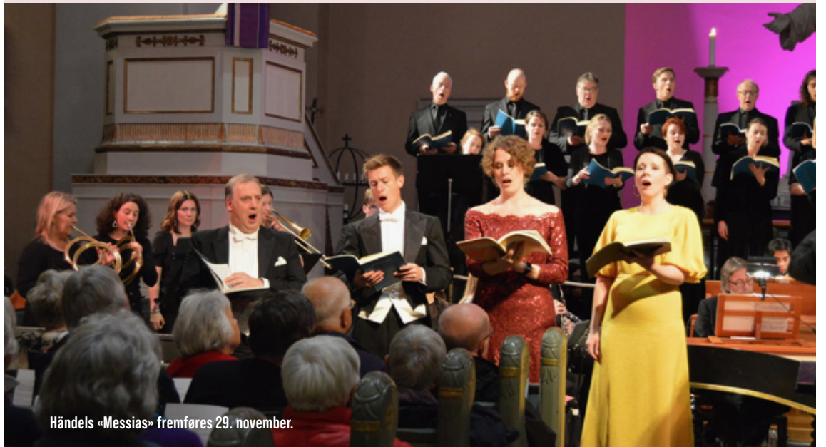
Händels «Messias» fremføres 29. november.

Kultursamarbeidet mellom Kirken i Halden og Halden kommune har resultert i et spennende program for høsten i Kulturkirken Immanuel.