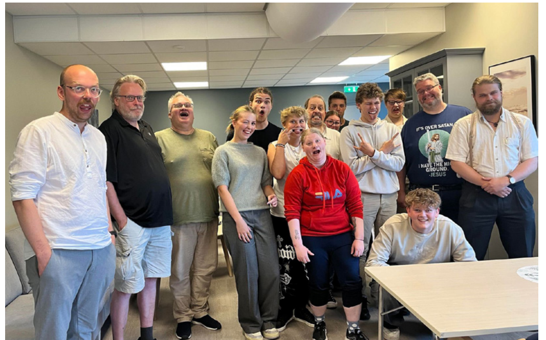
Obligatorisk grimase-bilde av ansatte og frivillige i konfirmantarbeidet.