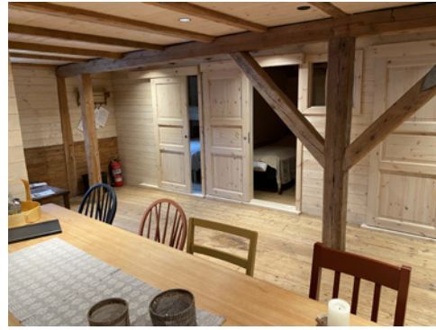
Dette bildet viser hvordan det er blitt med sovealkover i bakgrunnen.