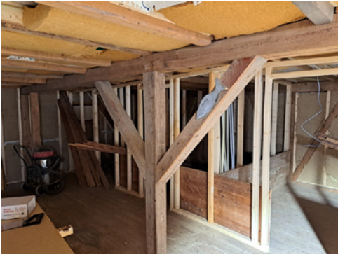
Dette bildet viser arbeidet underveis i andre etasje.