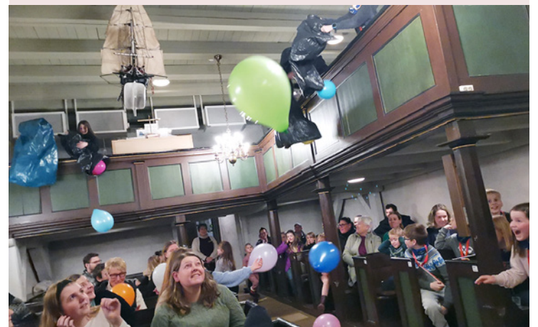
Det er alltid noe spennende som skjer når tårnagentene møtes. Bildet er fra Idd kirke.

Månedsskiftet januar/februar er årets morsomste månedsskifte i kirkene våre. For da arrangerer trosopplæringen i Halden tårnagent-lørdag.