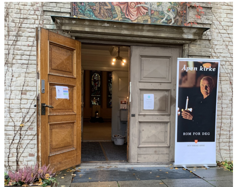
Mange kirker i Halden var åpne i forbindelse med allehelgens-helgen.

arbeidet er rettet mot etterlatte og sørgende. Og dette gjøres i form av sorggrupper og samtaler.