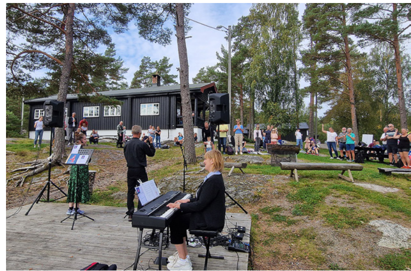
Mye folk på Barnas dag på Ormtjernhytta.

også vært utdeling av 4-års bok i Berg kirke. Den var lagt til en samling med Småtrolla. I Immanuelns kirke var den lagt