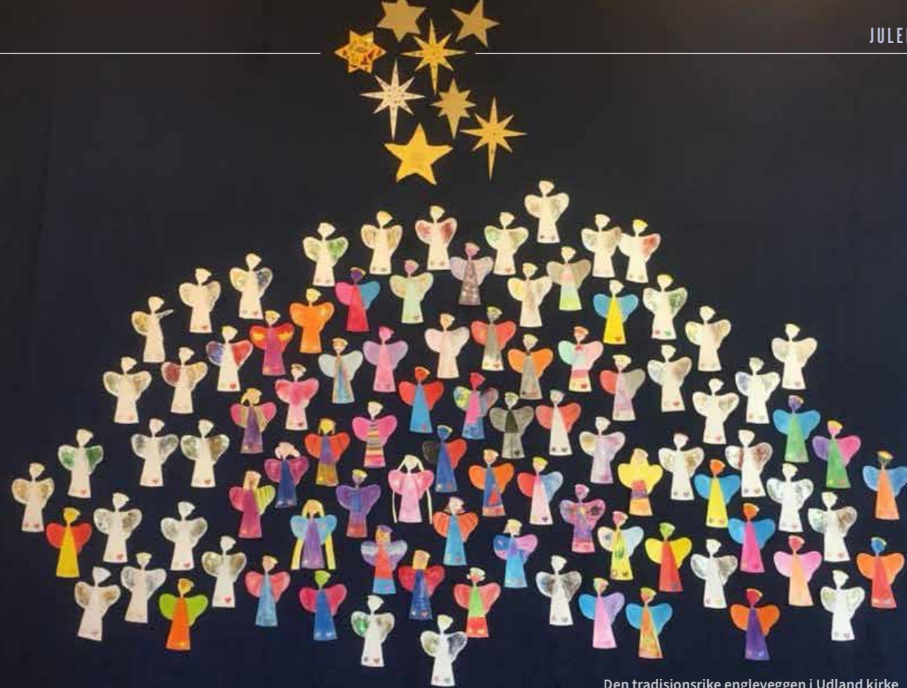
Den tradisjonsrike engleveggen i Udland kirke

FELLESKONTOR for kirkevergen og de tre menighetene i Den norske kirke i Haugesund. Her kan du henvende deg om alle tjenester og tilbud kirken har. Telefon: 52 80 95 00. Fellesnummer for de ansatte i menighetene, på kirkekontoret og kirkegårdsarbeidere. Åpent: Man-fre 08.00-15.30 – E-post: post.haugesund@kirken.no