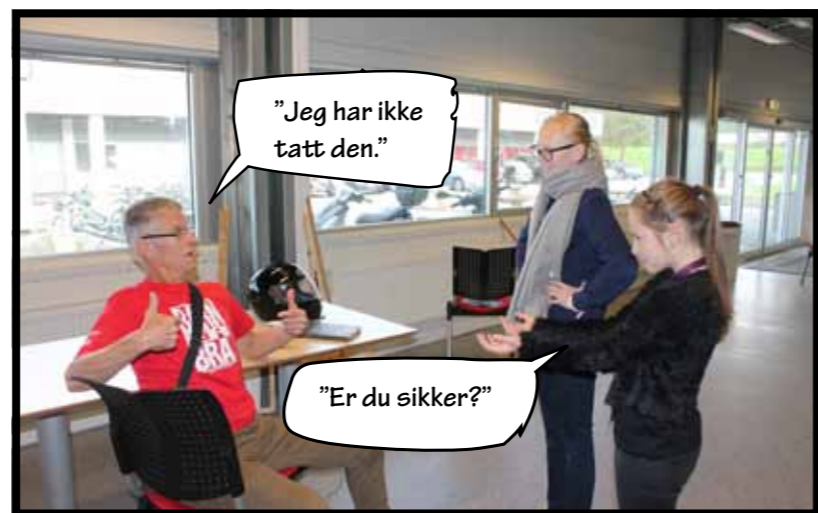
"Jeg har ikke tatt den."