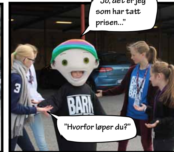
"Jo, det er jeg som har tatt prisen..."