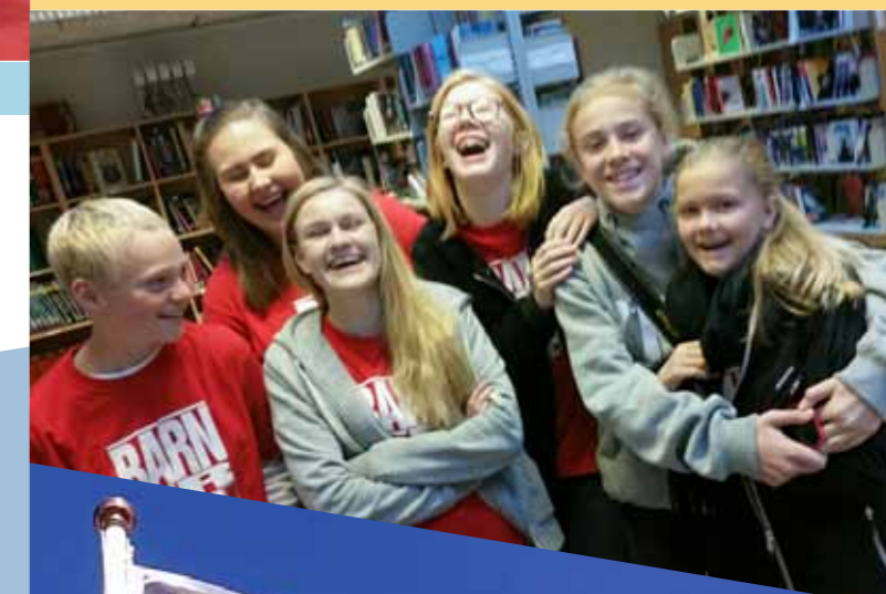
Tekst og foto: EIVIND LERVIK TORNLI

Takk for at du leste Barn er bra!-avisa!