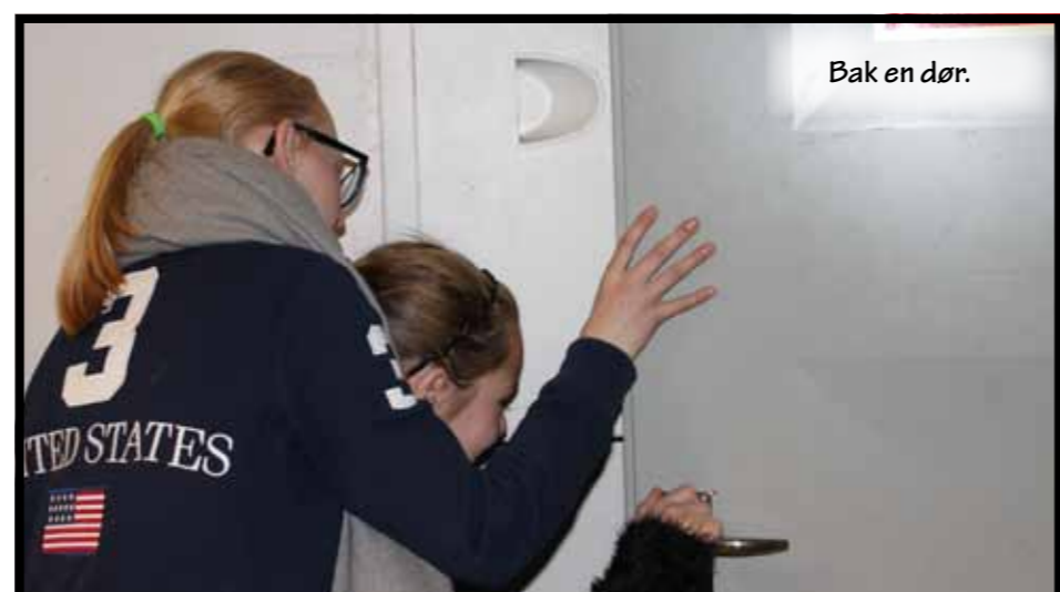
Bak en dør.

Tekst og foto: SIRI STORESUND HANSSON, SOLVEIG VIK OG ÅSA AASLAND HÅKONSEN