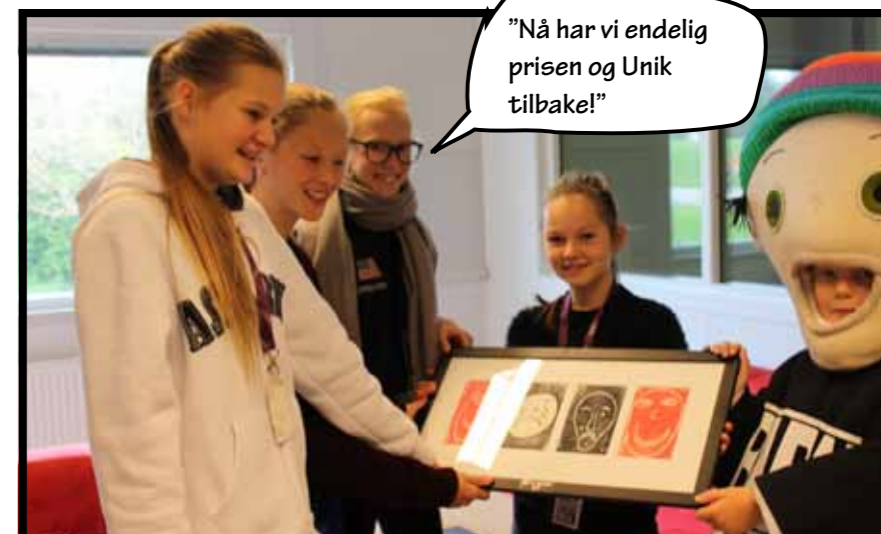
"Nå har vi endelig prisen og Unik tilbake!"