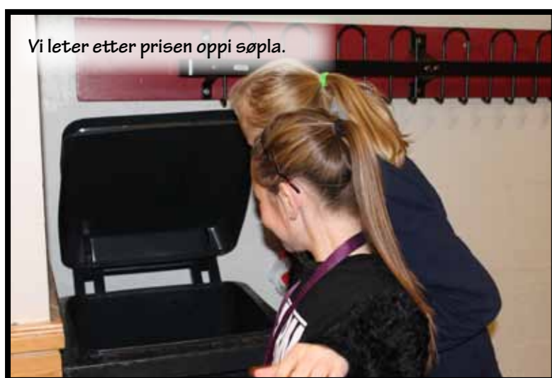
Vi leter etter prisen oppi søpla.