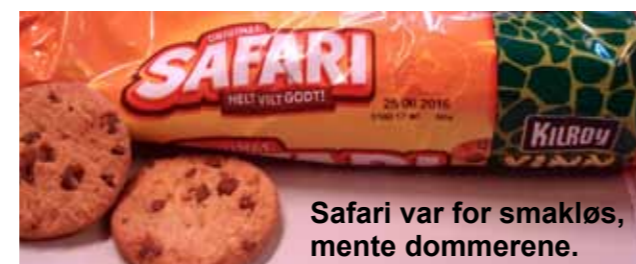
Safari var for smakløs, mente dommerene.