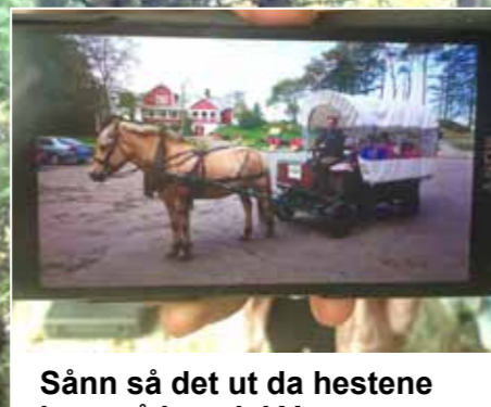
Sånn så det ut da hestene kom på besøk i Vangen.