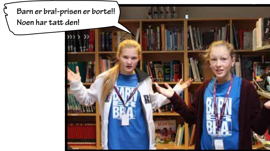
Barn er bra!-prisen er borte!! Noen har tatt den!