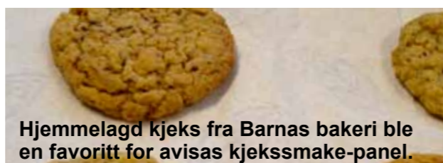
Hjemmelagd kjeks fra Barnas bakeri ble en favoritt for avisas kjekssmakte-panel.