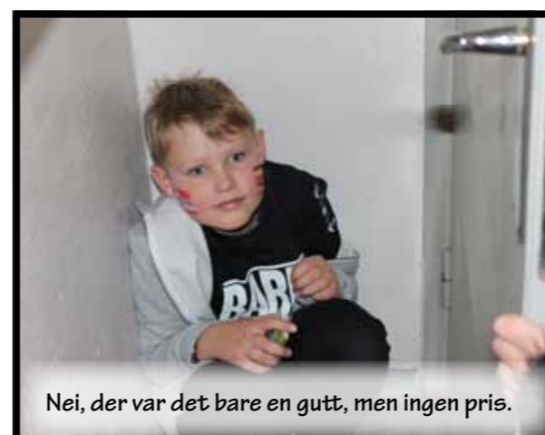
Nei, der var det bare en gutt, men ingen pris.

Tekst og foto: SIRI STORESUND HANSSON, SOLVEIG VIK OG ÅSA AASLAND HÅKONSEN