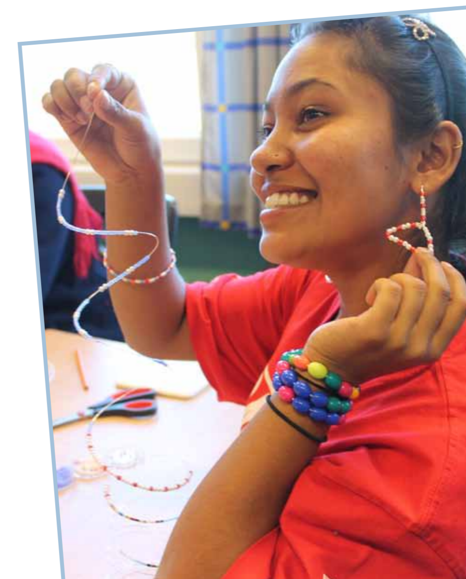
På Internasjonalt verksted lager de armbånd og noen har laget øredobber av perler.

Tekst: TMALIN SVEEN OG RENATE PETERSEN