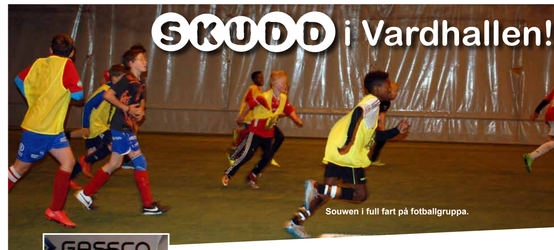
Souwen i full fart på fotballgruppa.