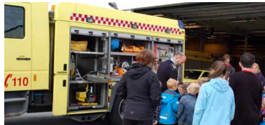
Her ser alle på utstyret i brannbilene og de får kjenne på noen av tingene.

Når vi var ferdige med å se på presentasjonen gikk vi ut å så på alle brannbilene. Vi så også på