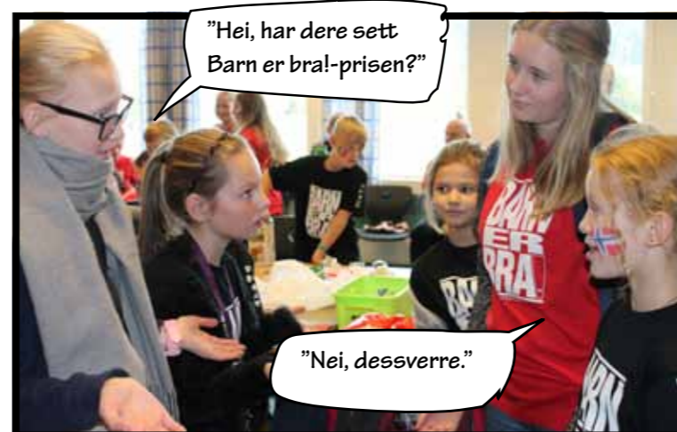
"Hei, har dere sett Barn er bra!-prisen?"