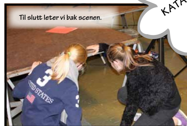
Til slutt leter vi bak scenen.