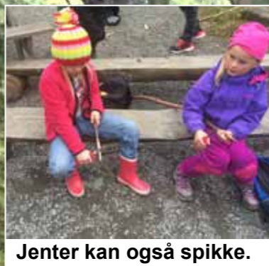
Jenter kan også spikke.