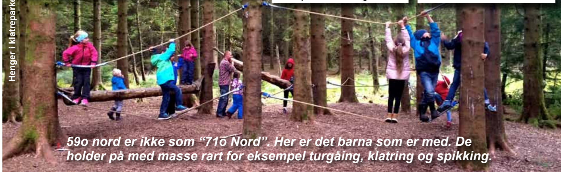
59o nord er ikke som "71o Nord". Her er det barna som er med. De holder på med masse rart for eksempel turgåing, klatring og spikking.

På mandagen satt de opp lavvo og de drakk kakao. På tirsdag hadde de fått besøk av noen hester, de striglet og koste med hestene. De kjørte også hest og kjerre. Det syntes de var veldig gøy. Senere på dagen hadde de padling i kano, men det gikk ikke så bra for det var for mye vind. På onsdagen