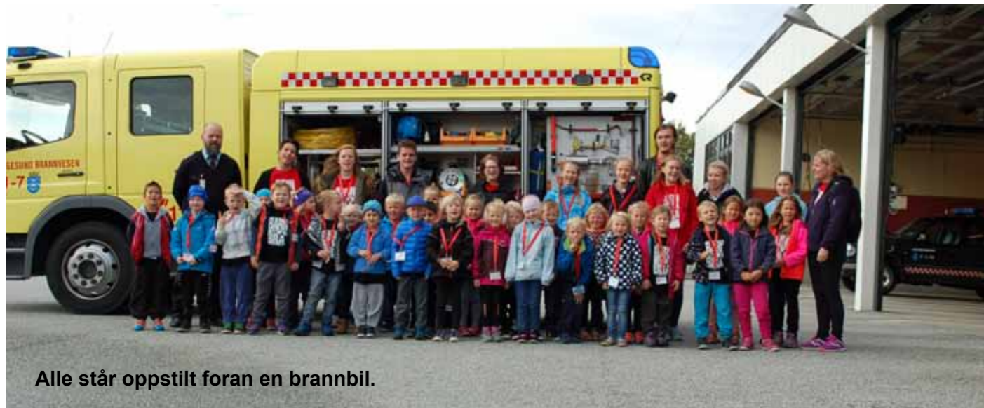
Alle står oppstilt foran en brannbil.

Jeg var så heldig at jeg fikk bli med Førsteklasseklubben til brannstasjonen. Da vi skulle til brannstasjonen kjørte vi en stor og fin buss. Det var litt bråkete, men alt gikk bra.