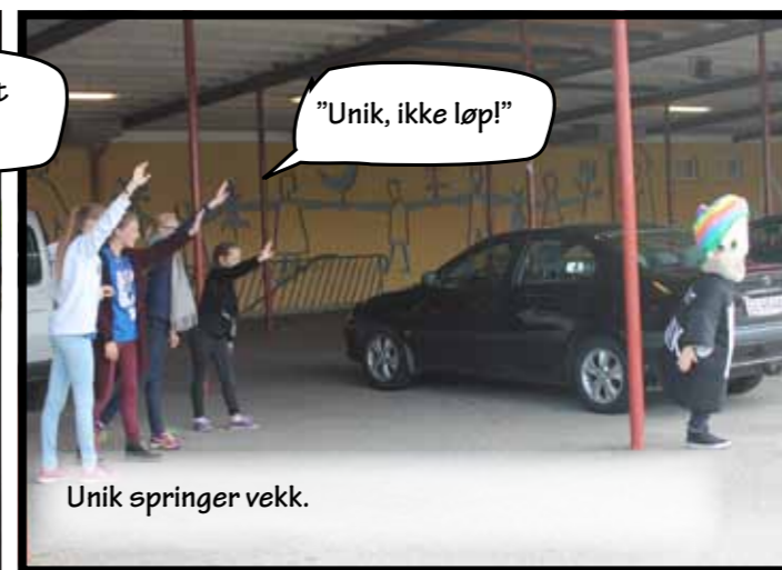
"Unik, ikke løp!"