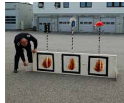
Her tar brannmannen opp blinken ungene skal skyte på.