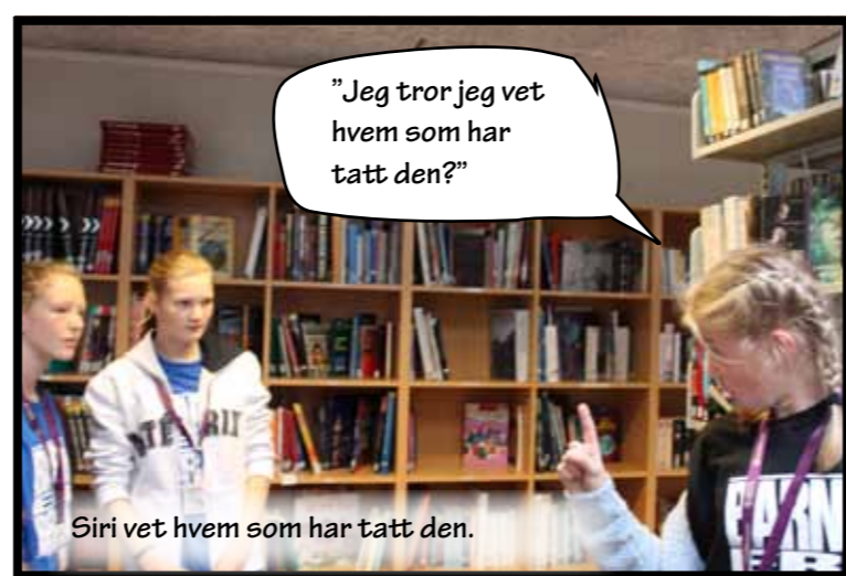
"Jeg tror jeg vet hvem som har tatt den?"