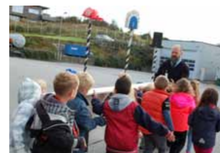
Ungene er sterke som greier å bære ut hele blinken.