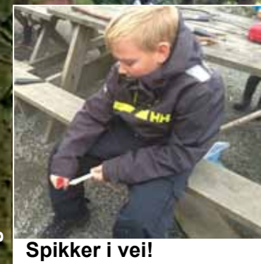
Spikker i vei!

Henger i klatreparken og smiler fra øre til øre.