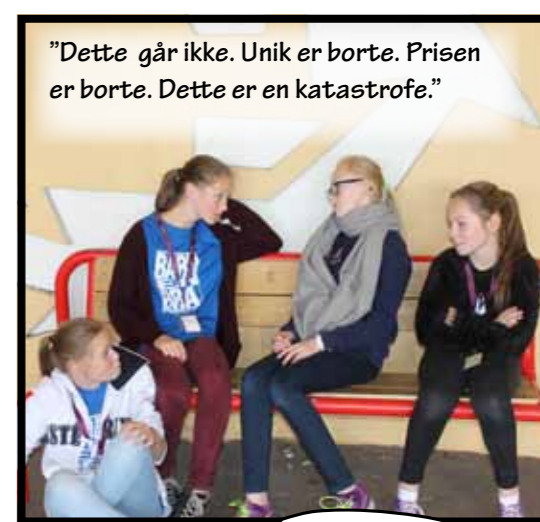
"Dette går ikke. Unik er borte. Prisen er borte. Dette er en katastrofe."