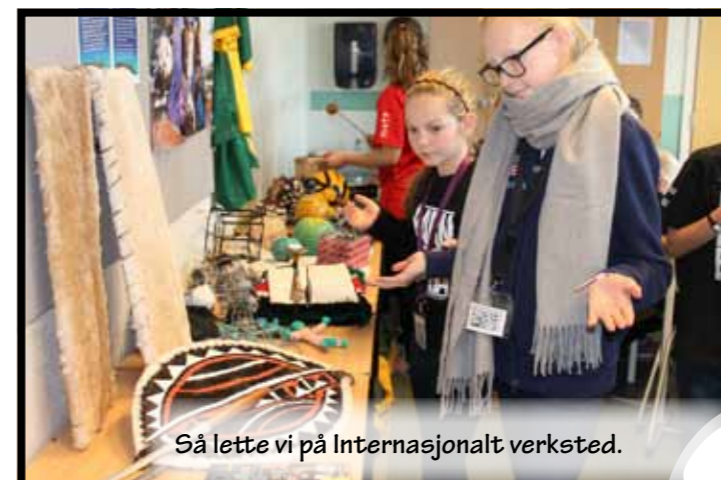
Så lette vi på Internasjonalt verksted.