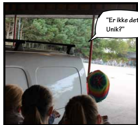
"Er ikke det Unik?"