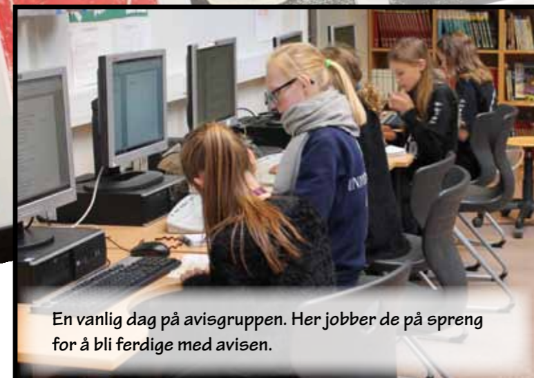
En vanlig dag på avisgruppen. Her jobber de på spreng for å bli ferdige med avisen.