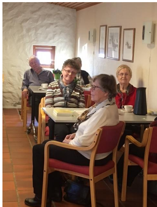
Fra Åpen Kirkestue

Adm.leder fungerer som rådets sekretær, og deltar på alle møter.