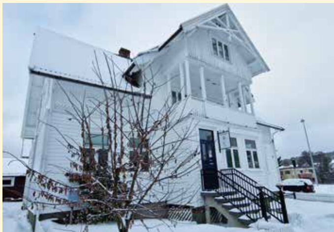
Fram leier lokaler i samarbeid med Mental Helse i Villa Groheim i Jørgen Moes gate på Grim.

Menighetsnytt takker for en inspirerende og lærerik samtale, og ønsker Fram lykke til videre med sin viktige brobygging i vår by!