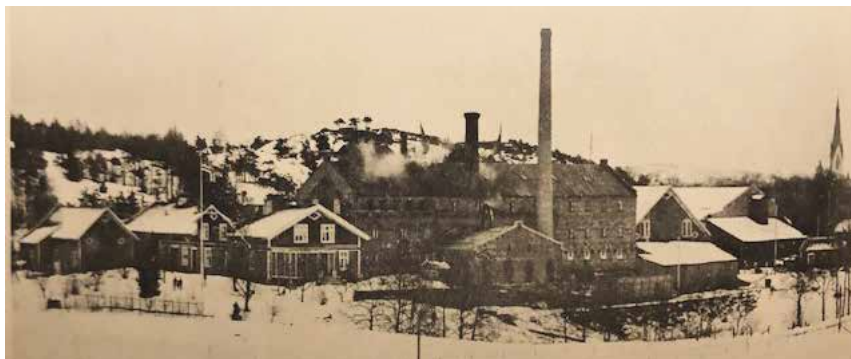
Christianssands Bryggeri ca 1920, sett fra Brønnstykket.