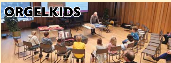
Åtte orgel interesserte barn deltok i vinterferien på et orgelkurs i regi av Knuden og Kirkelig Fellesråd.