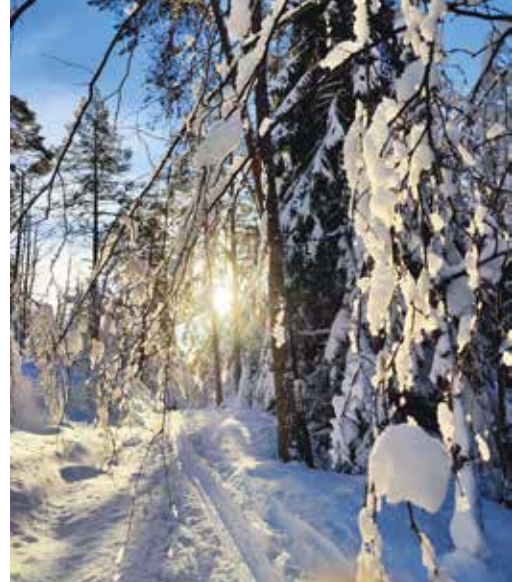
Flott og idyllisk stigning opp fra Kjærrane.

Mange har nok gode minner fra den tida Oddersjaa serverte kaffe og vafler på Bergstølytta. Hytta er nå borte, ski-vanene er endret, men stedet er likevel en flott plass å kunne ta en rast med medbrakt niste.