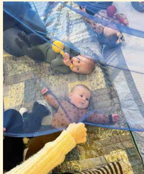
Babysang i Hellemyr kirke er et tilbud for barn opp til ett års-alder. Sang, rim og regler skal stimulere babyen og skape kontakt mellom foreldre og barn.

Velkommen til både mødre og fedre med babyer.