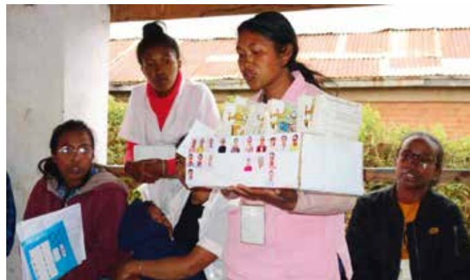
På Madagaskar støtter NMS et stort helseprogram som heter "helsetjenester for mor og barn."

På Madagaskar støttes et stort helseprogram som heter «Helse-tjenester for mor og barn». Dette programmet hjelper gravide kvinner før og under fødselen. Ett av de fem underprosjektene til dette programmet kalles Remafi. Her samarbeides det med tradisjonelle fødselshjelpere som har sluttet å assistere ved fødsler. Nå bringer fødselshjelperne gravide kvinner til helsesentre hvor de får den faglige hjelpen de trenger. Fødselshjelperne i Remafi-prosjektet – både kvinner og menn – er organisert i en gruppe som møtes regelmessig og støtter hverandre. Sammen driver de en spare- og lånegruppe.