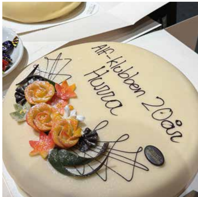
Deilig bløtkake ble servert på festen.