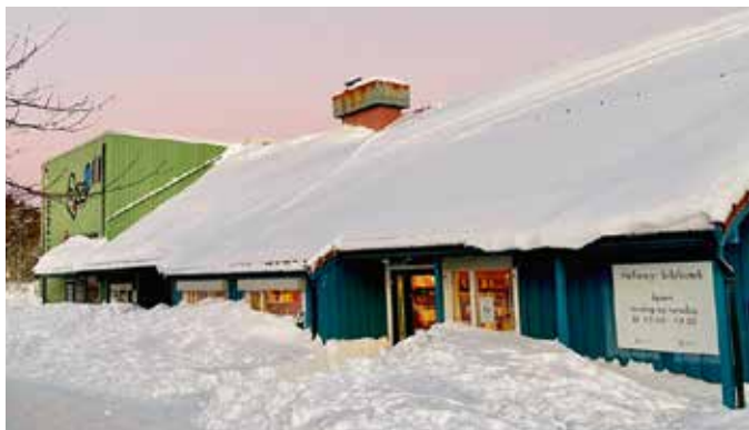
Hellemyr skole har 76 årsverk fordelt på 121 ansatte. Med nesten 500 elever er det en av byens største barneskoler.

Hellemyr bibliotek er åpent for alle tirsdager og torsdager mellom kl. 13 og 19.