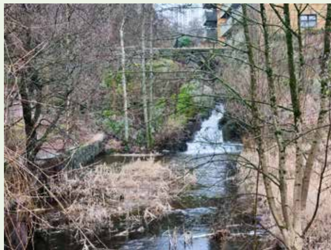
Fossen ved Grim mølle i fritt løp.

Fram til første verdenskrig rant Grimsbekken og Dalebekken ut i det store, kunstig oppdemte Møllevannet, som en innsjø for Christiansands Møller. Samlebetegnelsen Grimsbekken har blitt benevnt ulikt alt etter landskapet den renner i og hvilken funksjon