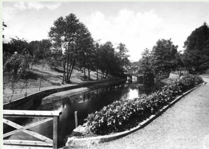
På bryggeritomten var det en gang i tiden en flott hage langsmed Grimsbekken. Ukjent årstall og fotograf.

5.Mosebok 8,7: For Herren din Gud fører deg inn i et godt land, et land med rennende bekker, med kilder og vann fra dypet som strømmer fram i dal og på fjell.