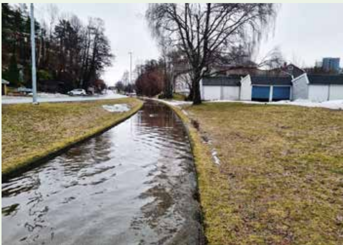
Ved store nedbørshendelser trenger bekken seg opp over gang og sykkelveien som ellers fungerer som lokk for bekken.

Vann og bekker er en kilde til gode møteplasser og felles aktivitet. Barn har til alle tider kost seg med å leke i vann, lage barkebåter, bygge demninger, for å nevne noe. Et viktig innspill fra turfølget er at ved å åpne opp bekken, har man mulighet for å lage flere gode treffpunkter i bydelen. Uformelle møteplasser og aktiviteter langs en bekk er helt gratis. Slike steder langs bredden av bekken kan gi rom for rekreasjon, ved bare å følge vannets bevegelser eller man kan få en god prat med en nabo eller tilfeldig forbipasserende.