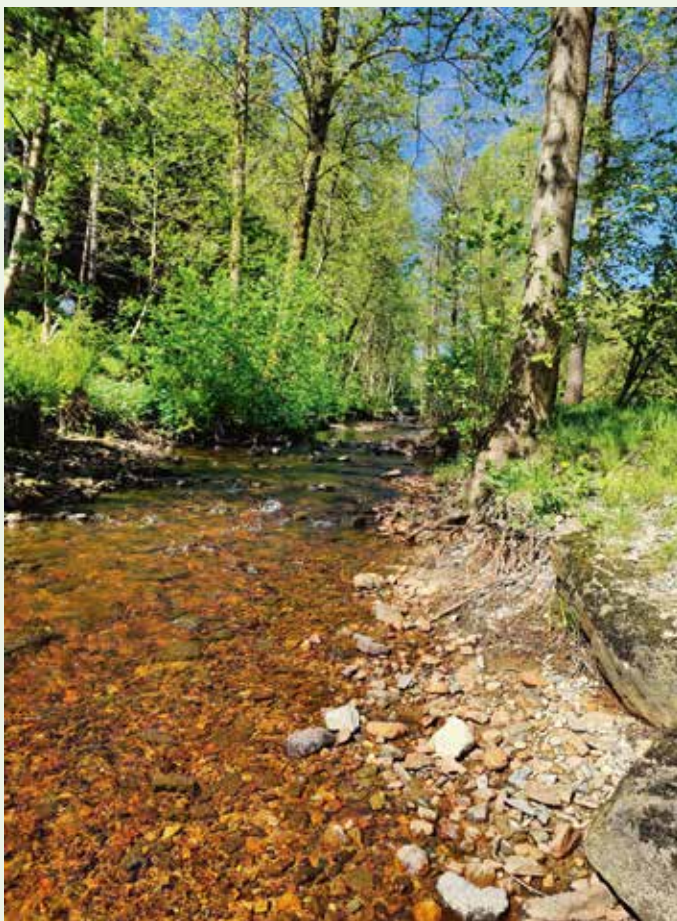
Sildrende vann i bekken øverst i Suldalen.