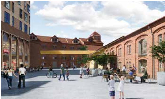
Dette bildet skal illustrere hvordan «mølletorget» kan se ut i framtiden.

Da politikerne fra by- og stedsutviklingsutvalget var på befaring i januar i år, høstet utbyggingsplanene mange lovord og superlativene satt løst. Ifølge Fædrelandsvennen kalte representanten fra SV prosjektet for en «formidabel forskjønnelse» og betegnet planene som kanskje det «kuleste vi har fått på bordet i denne valgperioden.»