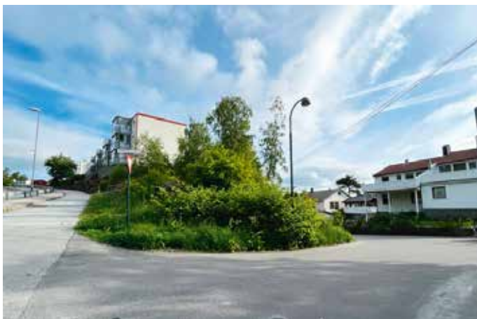
Her starter veien inn til «utbyggingseventyret». Like ovenfor ligger Peer Gyntveien.

På Tinnheia har de fleste veier fått navn etter ulike metaller. Det blir ofte referert til at dette er fordi Falconbridge Nikkelverk (nå: Glencore) ligger i området. Men starten på dette baserer seg visstnok på en stor misforståelse. Tinn skal være navnet på en liten fisk som ble funnet i tjønna øverst oppe på Tinnheia. Det er denne oppdagelsen som sannsynligvis førte til at vannet ble kalt for Tinntjønn og at veien oppover bakken fikk navnet Tinnheiveien.