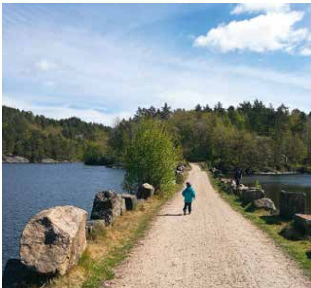
Veien over Kvislevann byr på idylliske detaljer. Denne fyllingen ble fullført i 1861 og var en del av ferdsselsveien mellom Oslo og Stavanger.

Denne gangen valgte vi å starte på Hellemyr, hvor vi fulgte lysløypa et stykke. Men med en 3-åring som turfølge, er det mye gøyere å gå på smale stier, hvor man kan klatre i trær og hoppe over steiner underveis. (Må innrømme at jeg sjøl også kjenner meg som en 3-åring på det området).