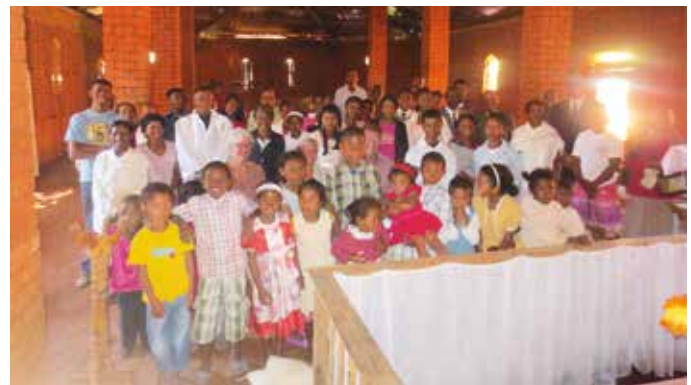
Her er menigheten i Behenzy avbildet sammen med gjestene fra Norge. De laget selv murstein og bygget kirken på egen hånd. De fikk midler fra Misjonsselskapets kirketakprosjekt til å legge bølgeblikk på taket.