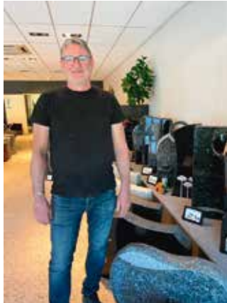
I butikken til Strandberg Stein kan man velge mellom 100 ulike gravsteiner.

å bestemme seg. De må også plukke ut alt av kantstein rundt beplantingsdelen på graven, forteller han. Hele prosessen fra bestilling til steinen er ferdig montert tar som regel ca 3 måneder, får vi vite.