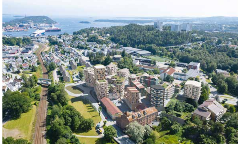
Dronebilde mot sør.

Ifølge avisen mente flere av politikerne at høyhus på 12 etasjer ikke var noe problem. Enkelte foreslo til og med at det kunne bygges helt opp mot 16 etasjer.