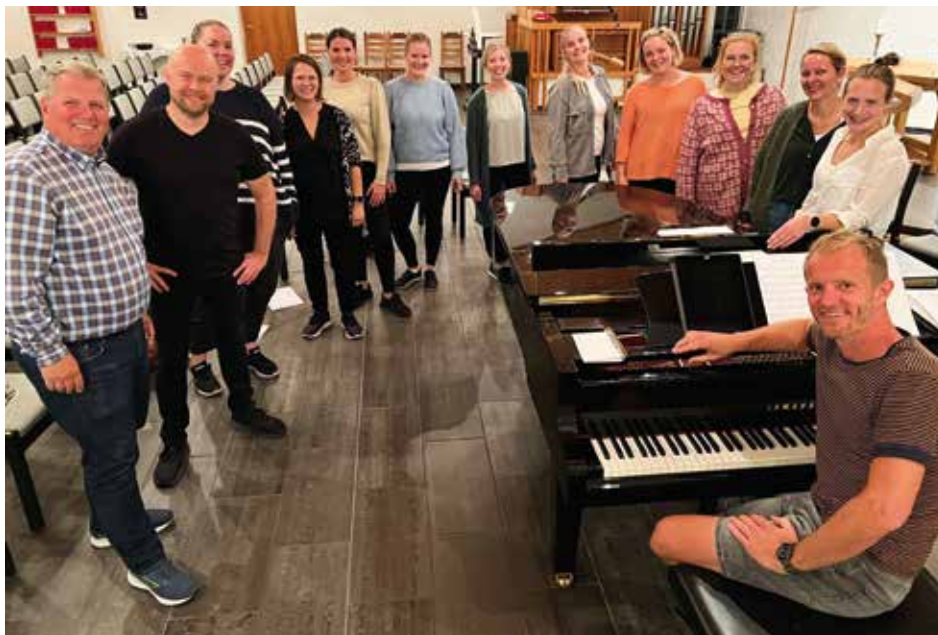
Her ser du nesten hele gjengen i Hellemyr gospel.