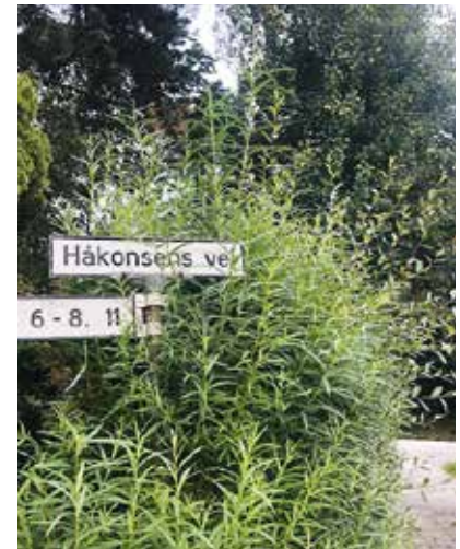
Dette veiskiltet blir snart historie. Kristiansand kommune har bestemt at oppsitterne i Kolsbergveien 6-8 og 11 skal skifte navn til Kolsbergveien.

Deres sønnesønn var siste beboer, og bodde der hele sitt liv, - hans malerier kan i dag betraktes i en samling på UiA.