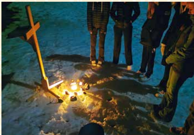
Lørdag kveld var det bønnevandring ute under stjerneklar himmel.