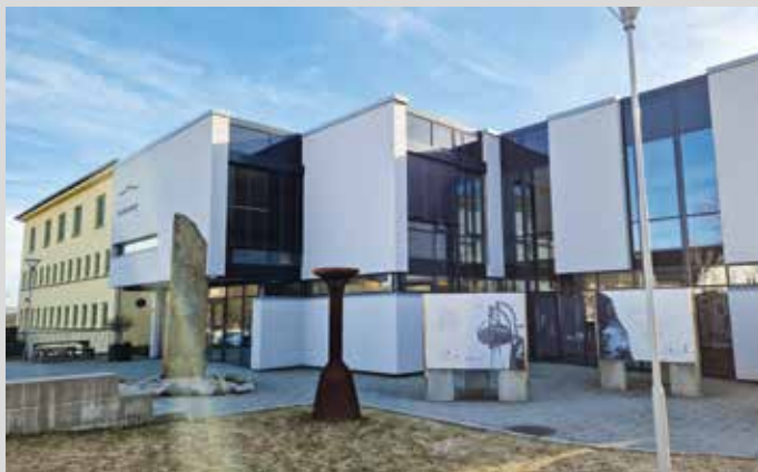
ARKIVET holder til i Vesterveien i Kristiansand.

I dag er ARKIVET er ett av syv freds- og menneskerettighets-sentre i Norge. Dette er syv uavhengige stiftelser som på hver sin måte bidrar til å fremme demokratiske verdier og holdninger, ikke minst rettet mot barn og unge. Alle driver med dokumentasjon, forskning, undervisning og formidling innenfor områdene demokrati, fred og menneskerettigheter, minoriteter og folkemord. Sentrene har blitt til «på grunnlag av en idé eller en historisk hendelse og situasjon som har skapt og utviklet det unike ved det enkelte senteret». Utallige skoleklasser har gjennom årene besøkt Arkivet for å få omvisning i kjelleren og kunnskap om krigshistorien, og lære om fred, demokrati og menneskerettigheter.