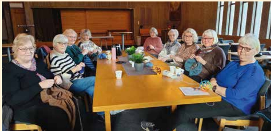
Høy trivselsfaktor med strikketøy og snakketøy hos disse damene en torsdag formiddag.

Treffene er åpne for alle uavhengig av tilhørighet til kirka. Alle er velkomne! Ingen uttalte heller at det ikke var åpent for mannfolk. Kanskje kan treffene også