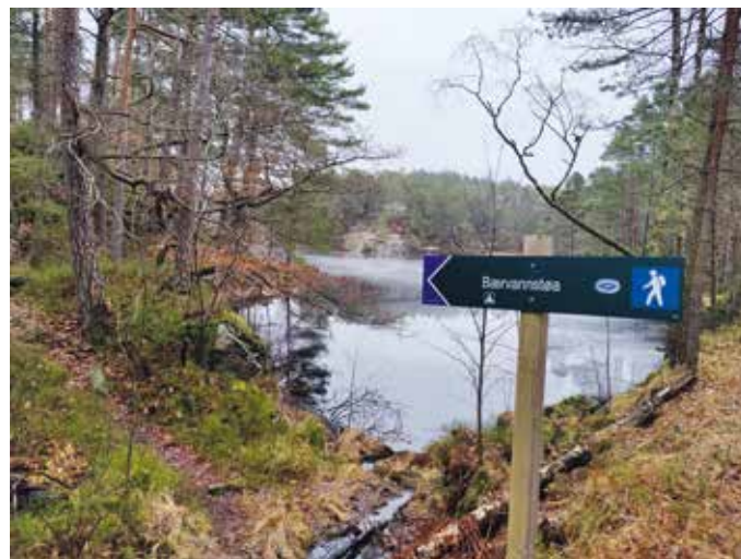
Et nytt og tydelig skilt ut til Bærvannstøa. Der er det fullt mulig å slå opp telt eller henge opp en hengekøye.

Vi valgte denne dagen å innta nista på denne odden. Hadde sola vært fremme, ville vi nok valgt motsatt side av vannet, siden det stort sett er morgensolen som kommer til på denne plassen. Videre fulgte vi stien langs med vannet, til vi kom til demningen på nord-vestsiden. På denne siden kunne man fulgt sti ned mot Storemyrvann, Grunnevann og Bjortjønn, og så ende opp ved Glitre og Dalane.