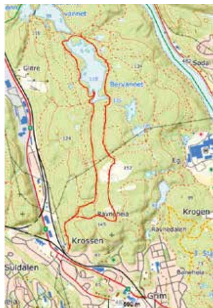
Vår valgte rute rundt Bærvannet startet på Krossen.

Vi oppdaget da et nytt skilt ut mot «Bærvannstøa». Vi har nok vært innom der før, men her er det nå kommet opp et nytt skilt og tydeligere sti ut til en fint opparbeidet bål plass. (Takk til dere som rydder stier og merker løyper!) Området er også såpass flatt at det fullt mulig kan settes opp et telt her. Alternativt kan man også feste en hengekøye mellom alle furutrærne i området.