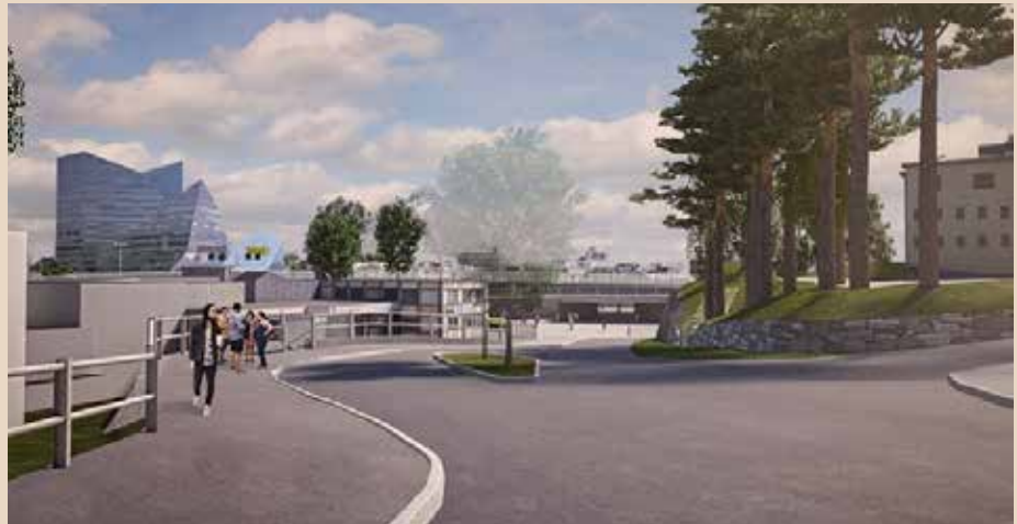
Denne illustrasjonen viser Møllevannsveien sett mot havneområdet. I enden av veien blir det en ny, bilfri plass. Til høyre ser vi Arkivet og til venstre Samsen. I bakgrunnen ser vi den nye brua, som ligger noe lavere enn dagens høybru.