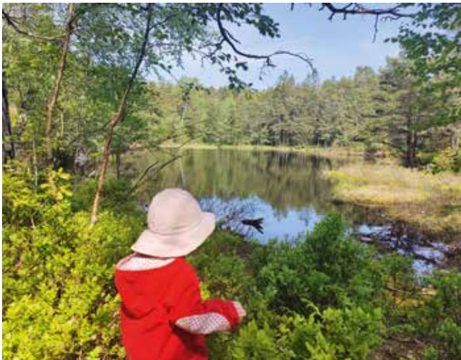
Rekreasjon for små og store ved idylliske Hestefallstjønn.

Det sies for øvrig at mange andre ikke er kjent i dette, vårt nærrområde. Men faktum er at denne idyllen ligger bare noen hundre meter inn i skogen fra Natriumveien, innerst på Tinnheia. Man passerer det som tidligere var overrennet til hoppbakken i Suldalen. All vegetasjon som er grodd opp i bakken i dag gjør at det ikke lenger er lett å se at her var det stor ski-aktivitet for noen tiår tilbake.