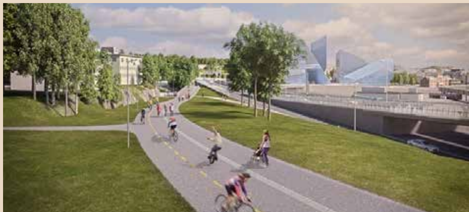
Her ser vi den planlagte sykkelspressveien, sett østover mot sentrum. Bygningen til venstre i bakgrunnen er Arkivet.