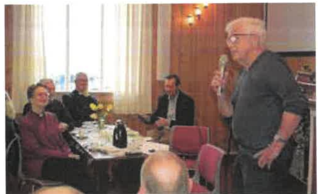
Møte med de frivillige på Asmaløy bedehus