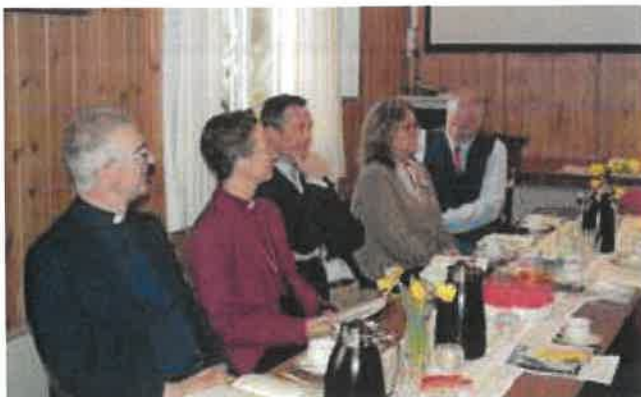
Møte med Hvaler menighetsråd