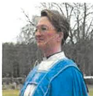
Før festgudstjenesten i Hvaler kirke

og kommunal ledelse til besøk på Dypedalsåsen og barne- og ungdomsskolen. På skolen var det et spesielt opplegg for 9. klasse hvor vi også har årets konfirmanter. En begeistret biskop fikk oppleve rekefangsten til videregående elever på fiskerilinja i Utgårdskilen og treffe mange ivrige og fornøyde arbeidere på VIUNO-bedriften.