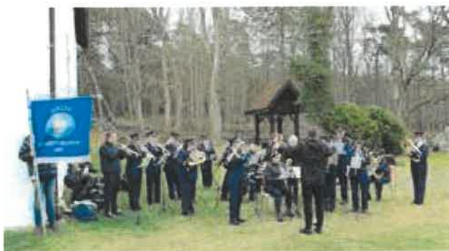
Korpsset spilte utenfor Hvaler kirke

gudstjeneste i Hvaler kirke. Her ble vi ønsket velkommen av Hvaler musikkforening som spilte utenfor kirken i forkant av gudstjenesten.