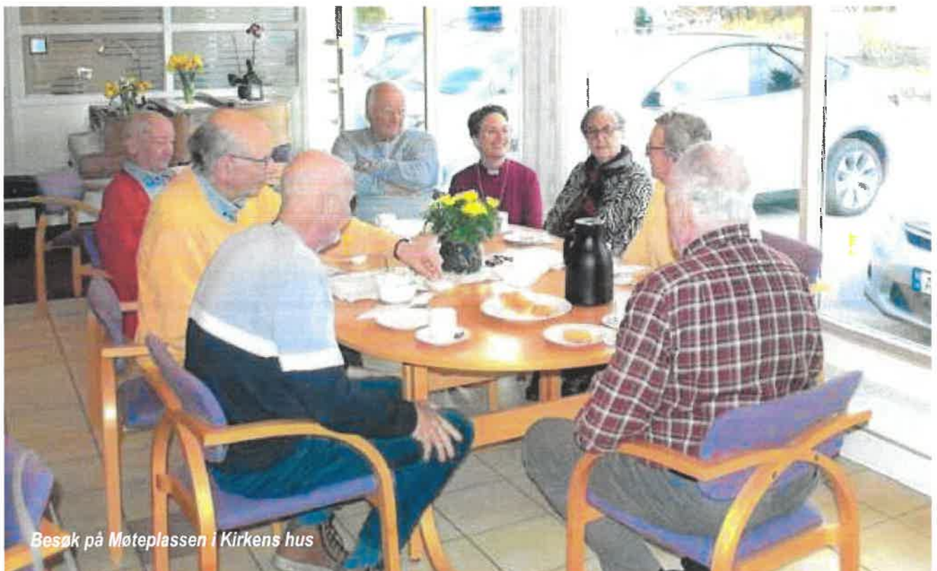
Besøk på Møteplassen i Kirkens hus

Kirken selv legger til rette for viktige fellesskap gjennom blant annet Møteplassen og Formiddags-treffet. Dette er godt klassisk diakonalt arbeid som på Hvaler bæres av frivillige. En ny og egen diakonstilling på Hvaler er neppe realistisk med det aller første, men det er absolutt mulig å benytte seg av den diakonifaglige kompetansen