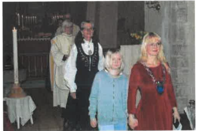
Utgangsprosesjonen etter festgudstjenesten søndag