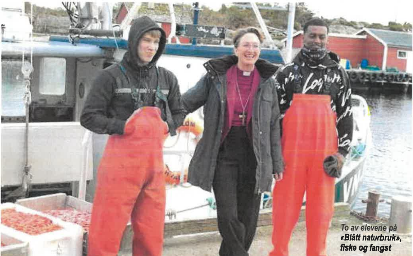
To av elevene på «Blått naturbruk», fiske og fangst

Vi har hørt mye om den gode samhandlingen mellom kirken og foreningslivet. Et resultat av dette er at Hvaler har få kunstige skiller mellom disse. Kirken har en naturlig plass i mange menneskers liv. Menneskene engasjerer seg på tvers. Hvis jeg skal peke på enda noen muligheter på dette feltet kan det være å samarbeide med både kommune, hytteforeningen og andre aktører om hvordan også deltidsbeboerne kan oppleve kirken som «sin». Mange av dem har sine beste tider i livet på Hvaler, selv om de har primæradressen sin et annet sted. De må få oppleve seg som fullverdige kirkemedlemmer også her, i de periodene de tilbringer livet her. Kanskje finnes her også mange som vil bidra til sommerkirken på Hvaler, med musikk, litteratur og annet frivillig arbeid?