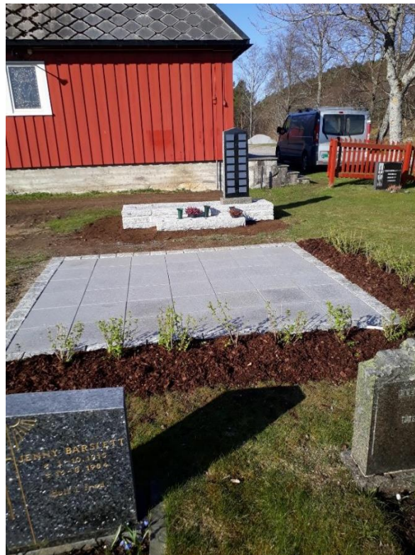
Navna minnelund på Frengen kirkegård

I løpet av året ble 3 navna minnelunder ferdigstilte. På Frengen, Stadsbygd og Stranda. På Frengen er det flere som er gravlagt på minnelunden, mens på de andre to plassene har det hittil vært få som har ønsket å benytte minnelundene.