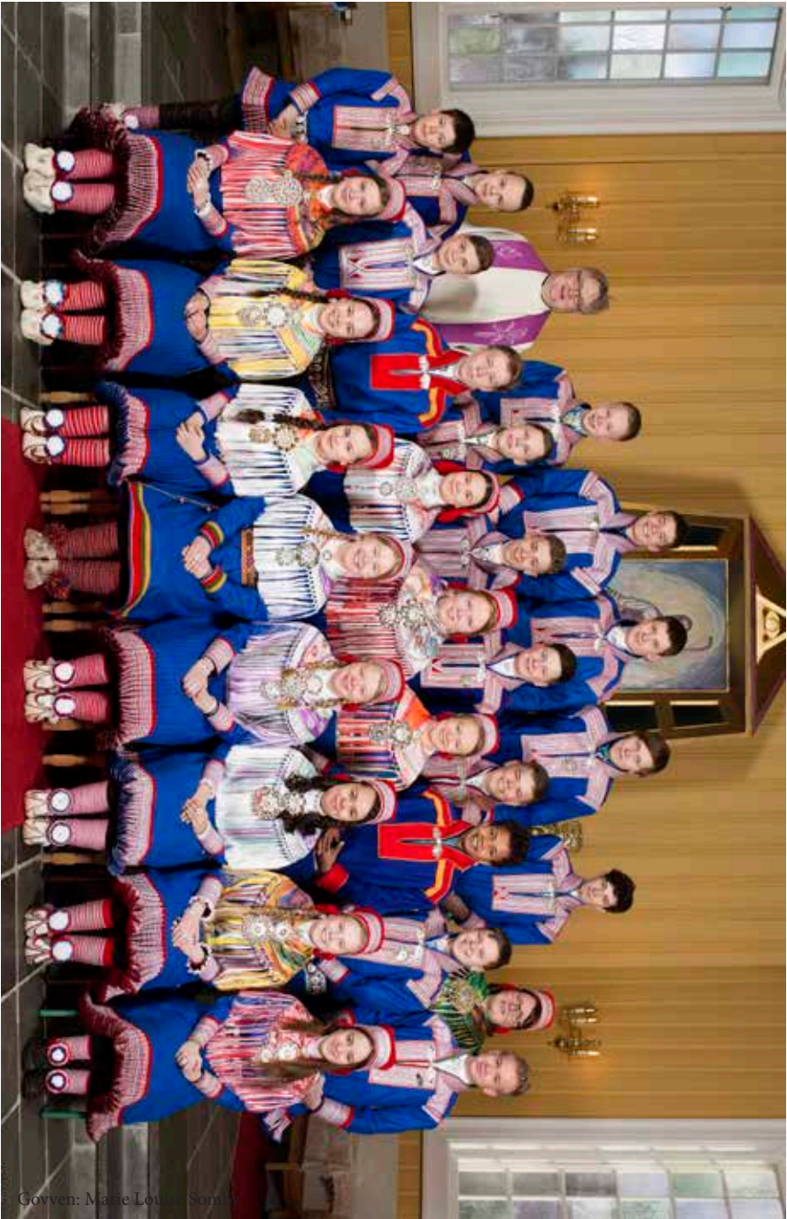
Guovdaggainnu konfirmánttat 2016