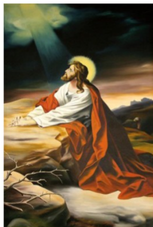
I bønnens stund sender Gud et lys

Originalen til framsdebildet er malt av tyskeren Johann Michael Ferdinand Heinrich Hofmann (19 mars 1824-23 juni 1911). Ifølge opplysninger fra Riverside Church i New York, er maleriet, Kristus i Getsemane , uten mye tvil et av de mest kopierte malerier i verden.